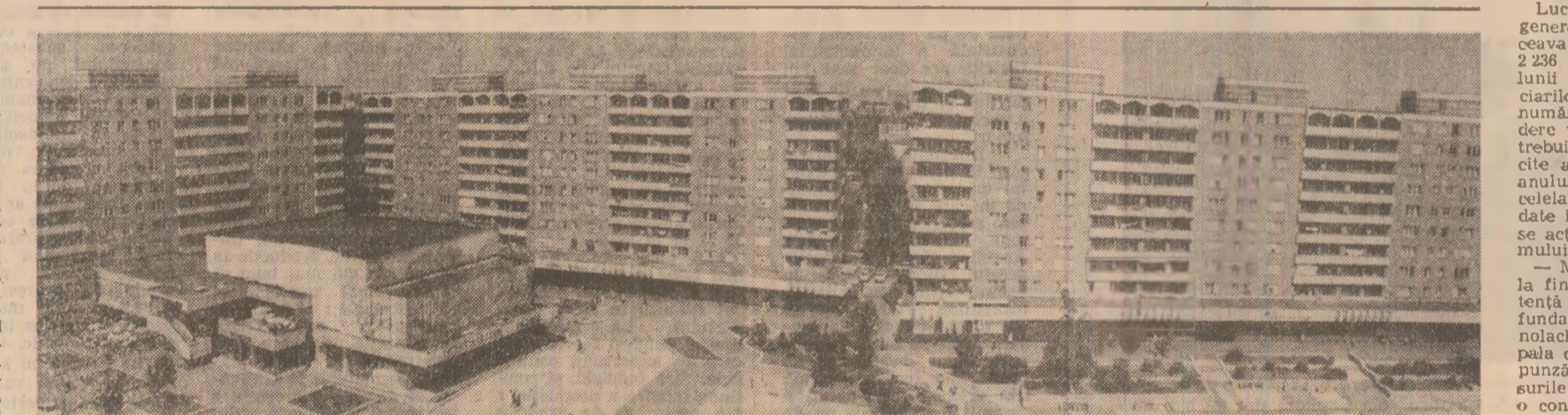
Noi construcții de locuințe în municipiul Oradea

„Dar dincolo de aleea principală? Ceea ce este prezentat la nivelul combinatului este adîncit și concretizat în secție, unde fiecare format este în măsură să curioasă partea sa de efort de lucru, inițiativă și creație. Este momentul să facem loc unei constatări. Dacă în spațiile de plan, masina trebuie să producă zilnic... De asemenea, sînt numeroase calculele privind efectele sporirii