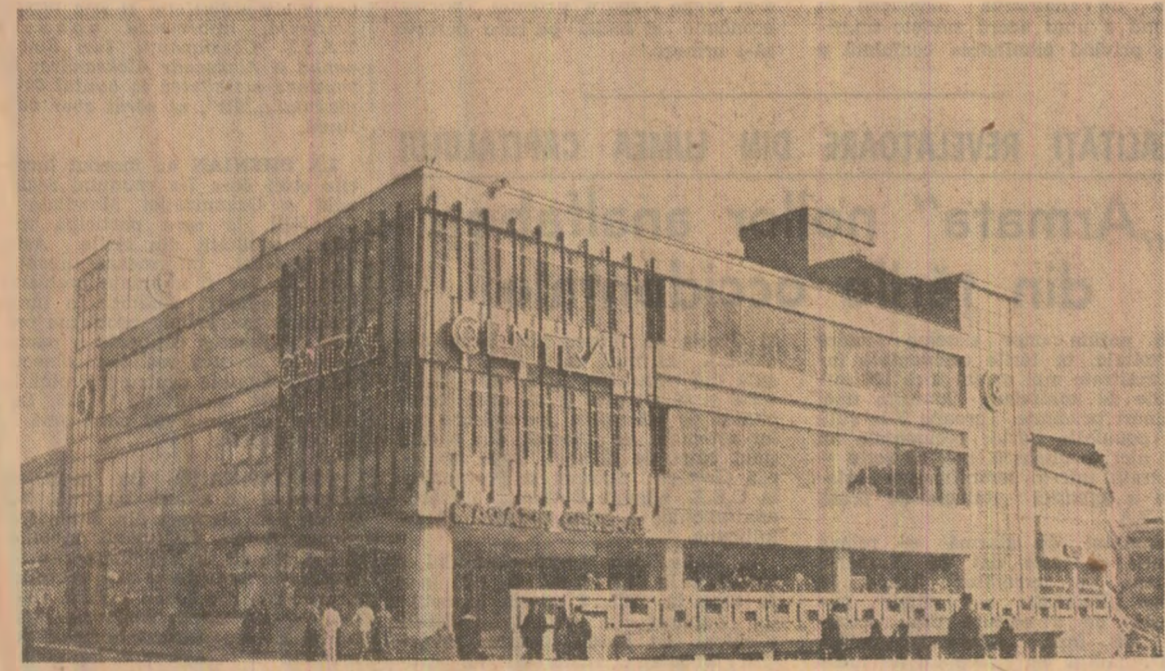
Magazinul „Central” din Caracal, județul Olt