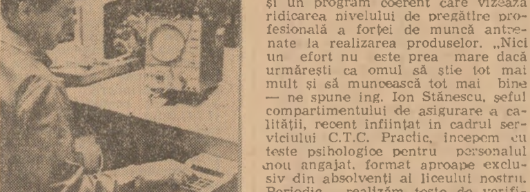
La intreprinderea „Electronica” din Capitala