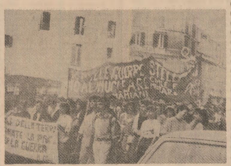
În ultima vreme, în Italia au avut loc mai multe demonstrații pentru dezarmare și pace cu prilejul cărora participanții s-au pronunțat împotriva prezentei celor 12 rachete nucleare de tip „Cosmos” instalate în baza militară a M.A.T.O. de la Comiso (Sicilia). A fotografia un aspect din timpul unei manifestații desfășurate la Roma

ROMA. — Acordul cu privire la eliminarea rachetelor sovietice și americane cu rază medie de acțiune și operativ-lactice ar putea realiza o cotitură în relațiile Est-Vest, a apreciat, într-un interviu acordat revistei „Rinascita”, secretarul general al P. C. Italian, Alessandro Natta. El a adăugat că, pentru prima dată, se pleacă de la premisa că securitatea nu se realizează prin superioritatea militară și prin arme nucleare, ci prin reducerea armamentelor, concepte care are la bază ideea că securitatea trebuie să fie reciprocă și globală.