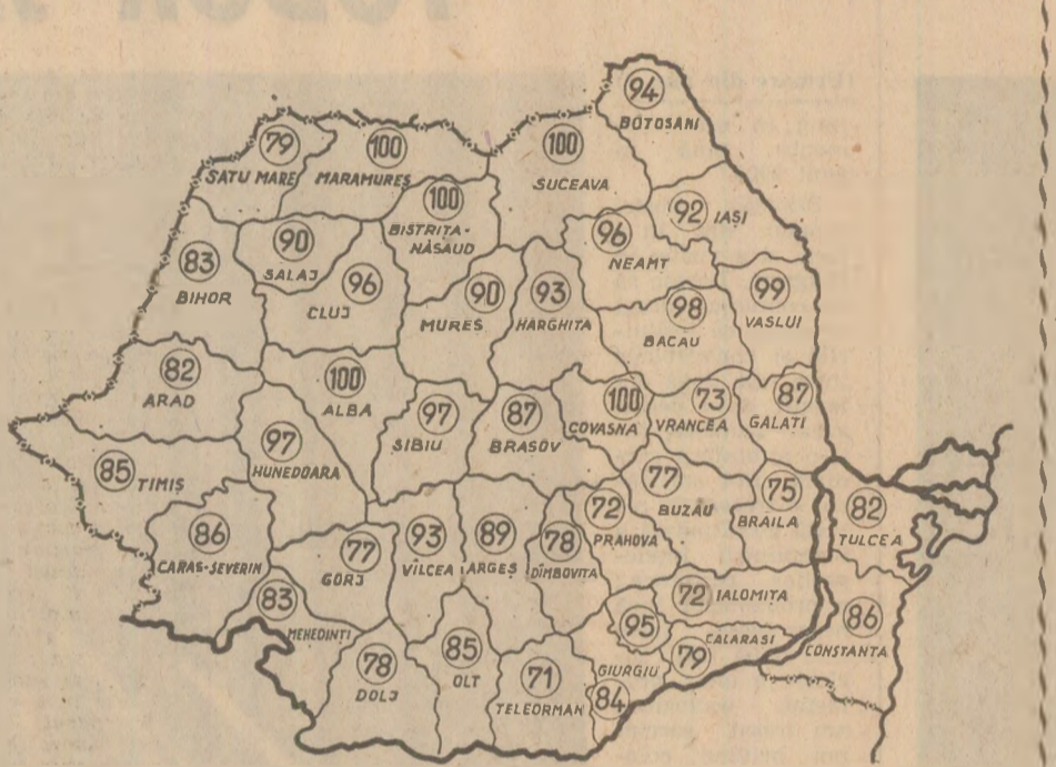
STADIUL ÎNSĂMÎNȚĂRII GRIULUI, în seara zilei de 8 octombrie, în procente, pe județe. (Date comunicate de Ministerul Agriculturii).

Acum, cînd termenul-limită stabilit pentru încheierea semănatului a expirat, stadiul însămînțării griului într-un număr de județe, și îndeosebi în cele mari cultivatoare, se dovedește a fi necorespunzător. Situația fiind importantă pe care o prezintă pentru nivelul producției încadrarea semănatului în limitele perioadei optime, rezultă că ritmul însămînțării griului trebuie accelerat la maximum, pentru ca sămînța să fie pusă sub brazdă în cel mai scurt timp posibil. Cu deosebire se impun măsuri energice pentru intensificarea lucrărilor în județele Teleorman, Ialomița, Prahova, Brăila, Buzău, Satu Mare, Gorj, Dolj, Dimbovița și Călărași, unde se constată și cele mai însemnate rămîniri în urmă. Folosind din plin timpul bun de lucru, organizînd activitatea temeinic, asigurînd executarea lucrărilor din zori și pînă se întunecă, inițind acțiuni de intrajutorare cu forțe mecanice unde este cazul, pretutînd este posibil și necesar ca însămînțarea griului să se încheie în una-două zile, fără nici o întârziere.