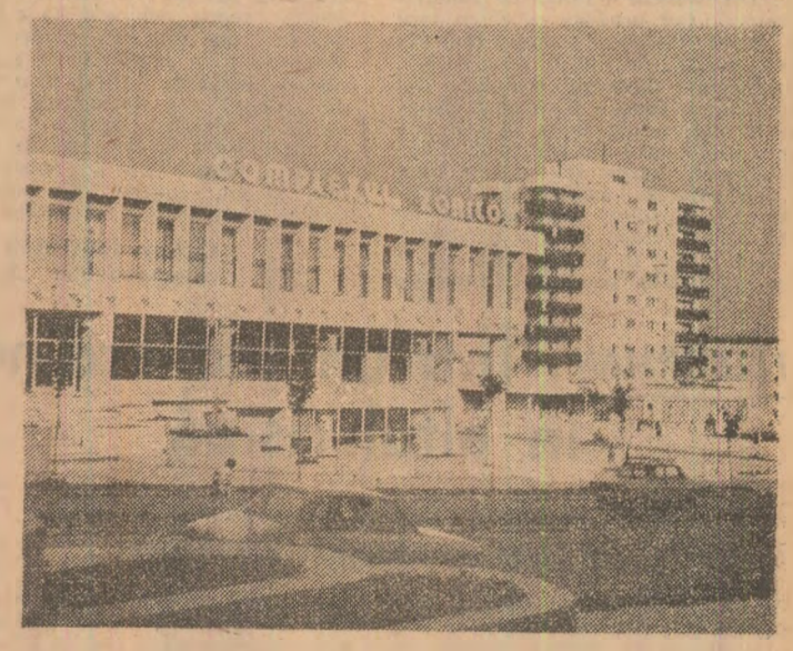
Municipiul Cluj-Napoca: Noile construcții din cartierul Florilor

Mihal DAMANFIL Mihal CUMĂNĂRESCU (Continuare în pag. a V-a)