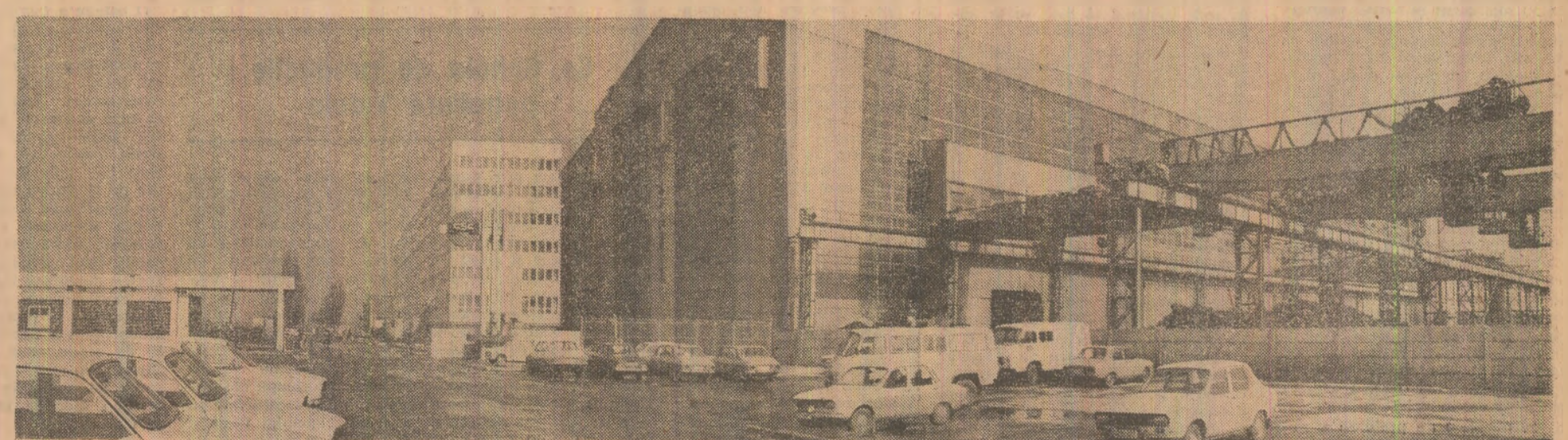
Vedere parțială a Combinatului siderurgic Cluj-Napoca

IAȘI: Producție peste prevederi Hotărîri să întîmpine Conferința Națională a partidului cu succese tot mai mari în producție, oamenii muncii din industria județului Iași înscriu pe graficul întrecerii socialiste semnate depășiri la producția fizică. Astfel, în perioada care a trecut de la începutul anului, industria ieșeană a realizat peste prevederi produse de mecanică fină, optică și de echipamente hidraulice în valoare de 25,5 milioane lei, mijloace de automatizare și componente electronice însumînd mai bine de 21 milioane lei, produse ale industriei electrotehnice și electrice de peste 20 milioane lei, mașini-unelte, prelucrătoare de metal prin achiere, utilaje și instalații pentru agricultură etc. De asemenea, au fost realizate, peste sarcinile prevăzute, 3 220 mc prefabricate din beton, 490 000 mp țesături din bumbac și tip bumbac, 11 000 radiocasetofoane, alte produse solicitate în țară și la export. (Manole Corcaci).