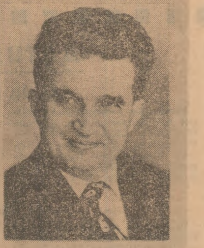
Președintele Nicolae Ceaușescu

Revista „Fair Idea” continuă: „Ca țară europeană, România contribuie activ la realizarea unui climat de pace și securitate în Europa, propunând o serie de măsuri pentru sporirea încrederii și garantarea păcii, cum ar fi o conferință pentru dezarmarea convențională în Europa, o conferință internațională pentru demilitarizarea spațiului cosmic și folosirea sa numai în scopuri pașnice și amicale. În același timp, România consideră necesar ca toate flotele din Mediterana și Oceanul Indian să fie retrase, să se renunțe la exercițiile și manevrele militare în apele interzise și să se adopte măsuri de protecție a securității internaționale și independente tuturor statelor.”