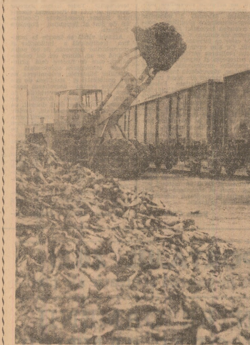
De la baza de recepție Drăgănești Vlășca, județul Teleorman, sfecla de zahăr este încărcată operativ pentru a fi transportată la fabrică în vederea prelucrării

Grija pentru ca tot ce a produs pămîntul și munca oamenilor să se strîngă cât mai repede, să fie cît mai bine pusă la adăpost constituie și în județul Satu Mare una din preocupările centrale ale unităților agricole în aceste zile fierbinți ale campaniei. În acest scop, specialiștii de cooperative și întreprinderi agricole de stat, comisiile de recoltare stabilite pe unități și ferme organizate vaste acțiuni de control. În cazul recoltării mecanizate a unor produse din cîmp, ca porumbul sau porumbul pentru siloz, s-au organizat echipe de cooperatori sau de elevi care recitau parcelele cu toată atenția și înregistrarea rezultatelor. Așa s-a procedat, obținându-se rezultate foarte bune, în cooperativele agricole Trzenci, Săntău, Medveș Aurit, Halmău, Mărtiniș Mic, Tășnad și multe altele. Nu peste tot însă s-a procedat așa, neglijențele avînd ca rezultat risipirea unor produse — chiar dacă nu în cantități mari — recoltate din cîmp. Astfel, la C.A.P. Onușuț, în marginea parcelei „Reduță” din ferma nr. 6 puteau fi donăzîți vîzuiți destui știuleți cîzuți și striviți sub roțile mijloacelor de transport. Faptul că seful fermei era în acel timp la altă parcelă, supraveghind însămintarea grîului, nu-l absolvă de răspundere pentru paguba pricinuită și care putea și să nu se organiză imediat o formație