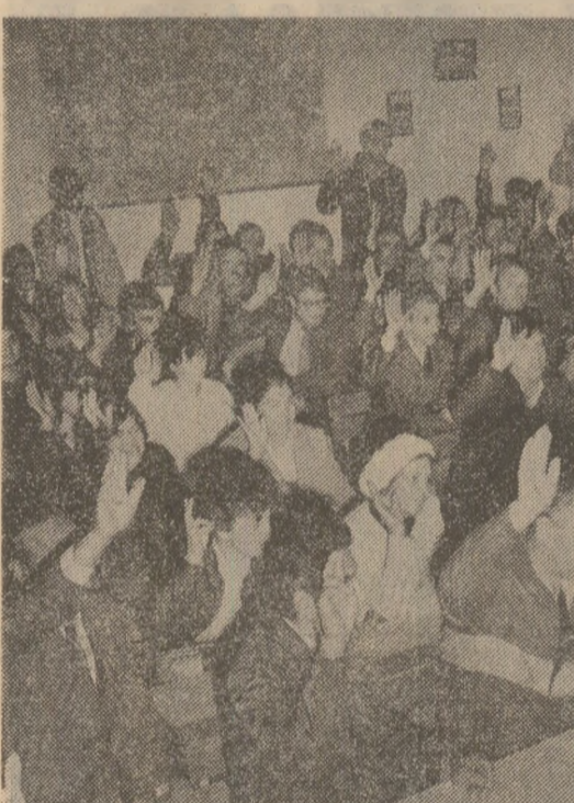
Ieri, la adunarea alegătorilor din circumscripția electorală nr. 5 a sectorului 2 din Capitală.

vădit bazate pe forța de muncă și resursele locale. Aici funcționează întreprinderea de creștere și îngrijire a porciiilor, fabrica de nutrețuri combinate, topitoria de cîneșă, secția de semindustrializare a legumelor și fructelor. Toate, împreună cu C.A.P.-ul, realizează o producție anuală de peste 630.000.000 lei. În numărul personalului muncitor este de 4.000 de oameni din cei 8.000 locuitori. Progrese urbane: pe lîngă aștele și aștele de case noi ridicate de cetățeni, comuna este un blocuri cu 120 de apartamente, cu spații comerciale la parter, cu apă la robinet și canalizare. Alte atribuție orșenești: centrală telefonică, centrală termică, trei sanitar-restaurant, cîmîn cultural, dispensar medical, drumuri asfaltate, covoare de flori... Toate ridicate prin eforturile gospodăriei comunei. În adunarea de ieri cel ce au luat cuvîntul, susținînd propunerea de candidatură, și-au exprimat hotărîrea „de a deveni orșeni producători de piine”. Nu-s doar vorbe frumoase, ci puncte bine stabilite în programul actual al campaniei electorale — programul lor de muncă. „Seara, despărțindu-se în picurii spre case, oamenii își dădeau „binețe”. Ne vedem mîine la muncă! Așa înțeleg hîrnicii gospodari, oamenii fanțelor, să dea viață dialogurilor electorale, să împlinească apropiatele aiegeri de deputați”. Sava BEJINARIU corespondentul „Scintei”