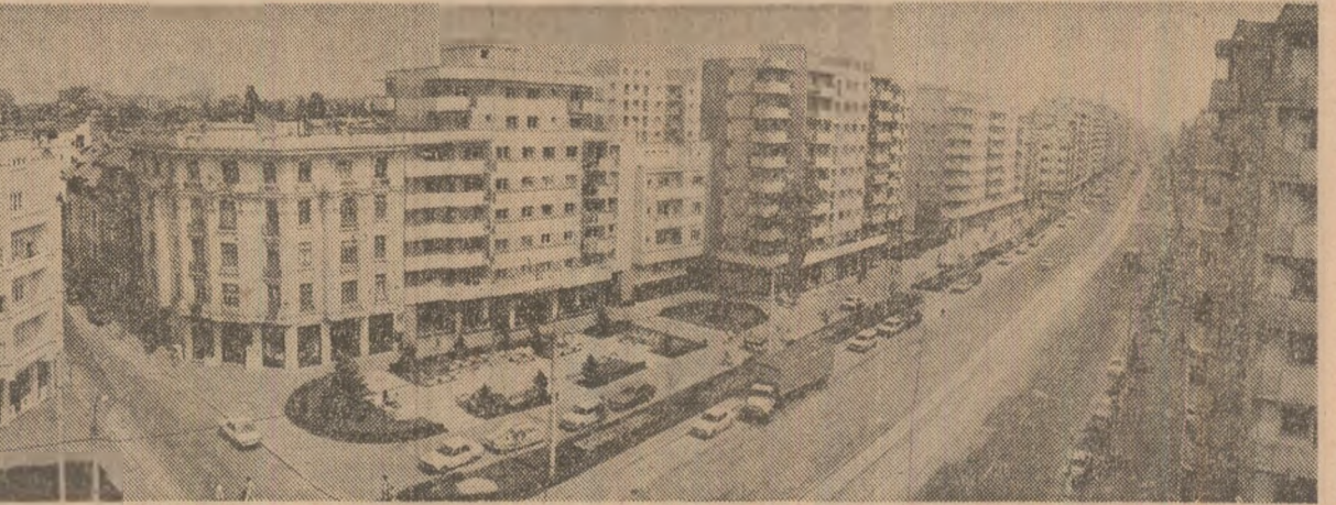
„Calea Moșilor” din Capitală