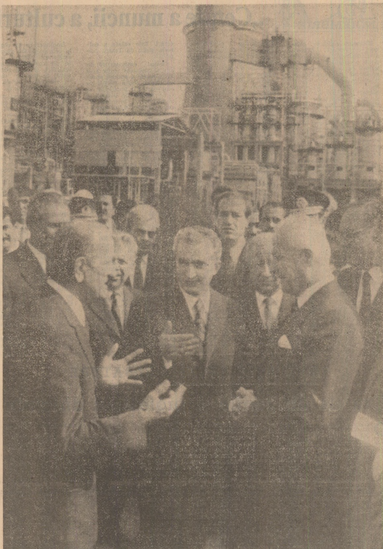
În timpul vizitei la rafinăria „Anatolia centrală”

Au luat parte membri ai guvernului, alți reprezentanți ai vieții politice turce.