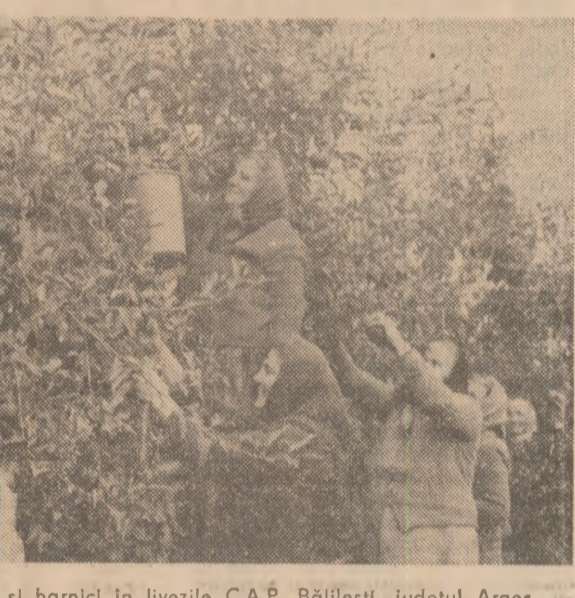
Culegătorii mulți și harnici în livezile C.A.P. Băilești, județul Argeș