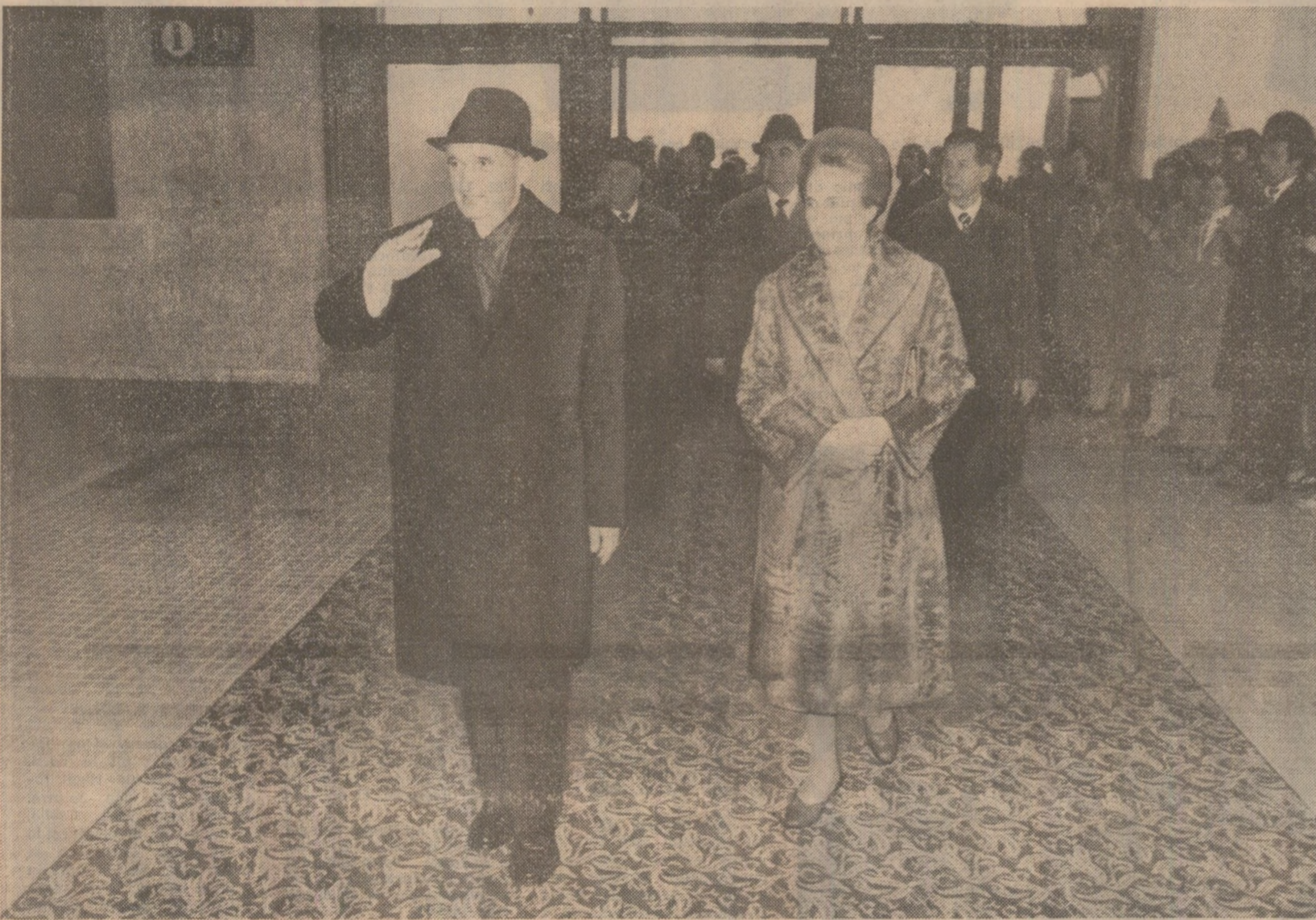
In prezența tovarășului Nicolae Ceaușescu, secretar general al Partidului Comunist Român, președintele Republicii Socialiste România, și a tovarășei Elena Ceaușescu a fost dată în exploatare, sâmbătă, 24 octombrie, noua linie de metrou cuprinsă între Piața Unirii și platforma industrială Pipera.

a fost dată în exploatare linia de metrou cuprinsă între Piața Unirii și platforma industrială Pipera