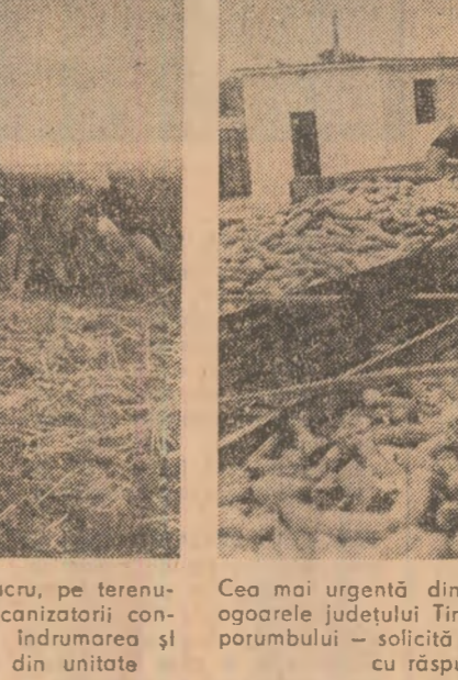
Cea mai urgentă dintre lucrările acestor zile de pe ogorele județului Timiș - transportul și depozitarea porumbului - solicită un efort deosebit care trebuie făcut cu răspundere pentru recolta