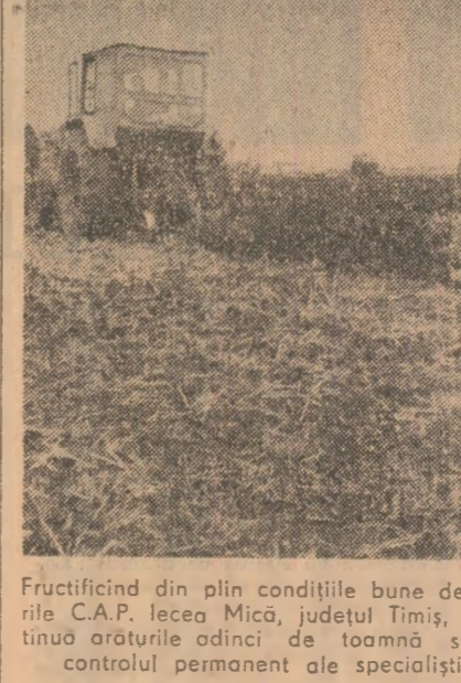
Fructificând din plin condițiile bune de lucru, pe terenurile C.A.P. lecea Mica, județul Timiș, mecanizatorii continuă arăturile de toamnă sub îndrumarea și controlul permanent al specialiștilor din unitate