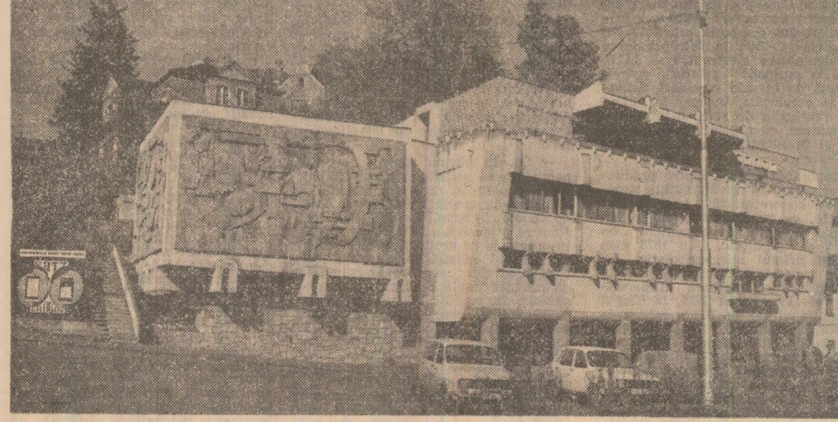
Casa știnței și tehnicii pentru tineret din Brașov