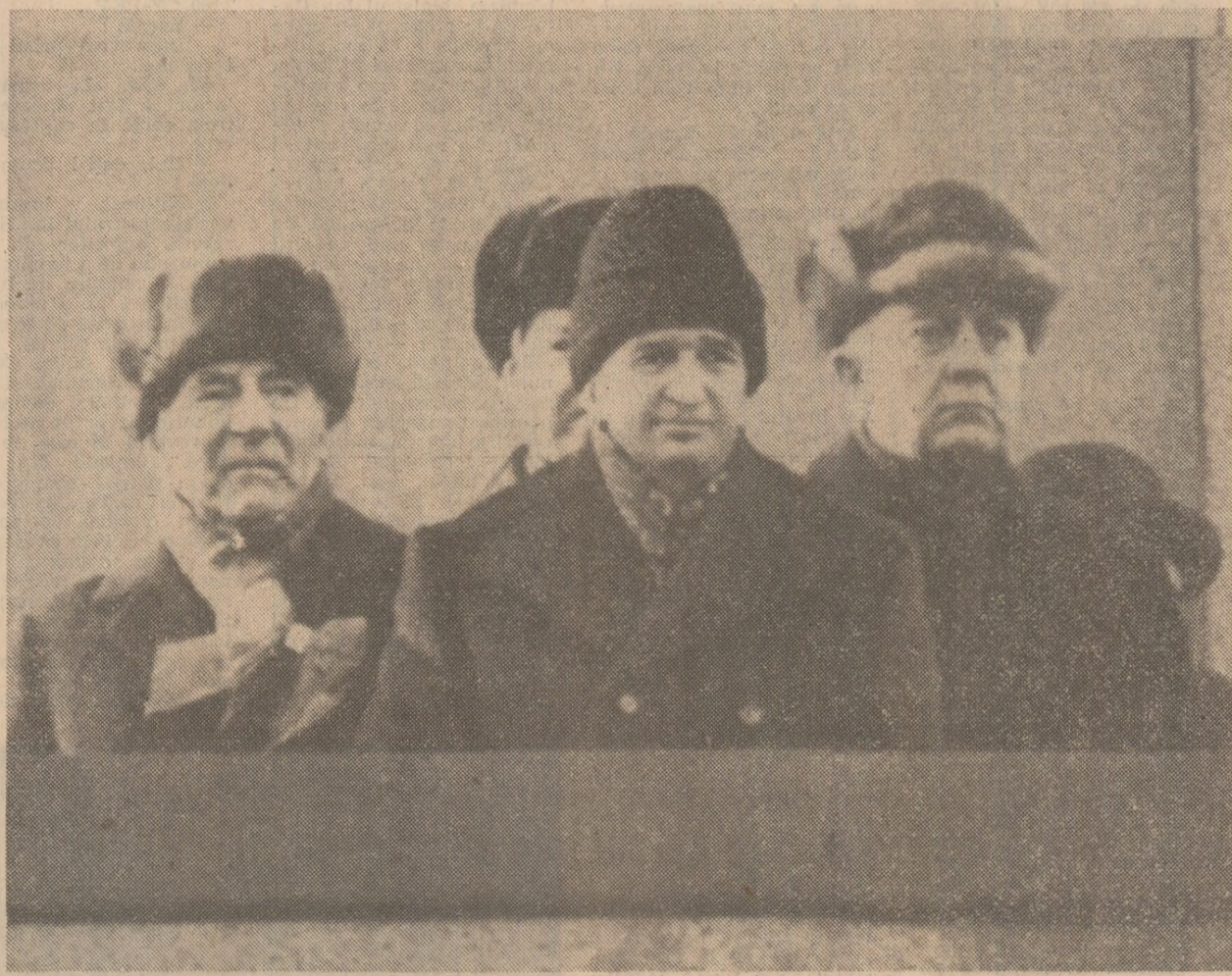
A urmat parada militară.

General de armată D. Izov, membru supleant al Biroului Politic al C.C. al P.C.U.S., ministrul apărării al U.R.S.S., a rostit o alocuțiune de la tribuna Mausoleului.