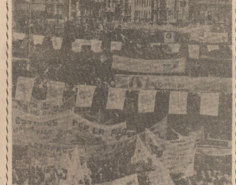
Zilele trecute, la Madrid, a avut loc o amplă demonstrație pentru pace. Cu acest prilej, peste 30.000 de persoane au manifestat pe străzile orașului, prunându-se împotriva prezentei bazelor militare americane pe teritoriul Spaniei și pentru înlăturarea tuturor armelor nucleare din Europa.