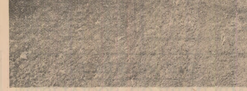
TELEORMAN: Ritmul de lucru trebuie să crească simțitor

Am verificat în mai multe unități lacă motorina (altă cită a fost primită) u a fost folosită la alte lucrări. Ve-am convins că nu. Argumentul îl fferă suprafețele arate, care corespund cantităților de motorină normale pentru această lucrare. În conștient agroindustrială Cocora, unde înt de executat ogoare adânci de oamnă pe 12.211 hectare, până în ara zilei de 4 noiembrie lucrarea s-a realizat doar pe 30 la sută din aprafată, față de 63 la sută, cum vedea programul stabilit și înscrise de fiecare unitate. Cu 31,8 litri le motorină se executa arătura adâncă pe un hectare la 30 centimetri, și pe un hectare la 50 centimetri, de lungul fiind perfect reglat și echilibrat u scormonit și grăpat cu colți. Ca fitea arăturii este foarte bună și oate rădăcinile de porumb și floarea-soarelui sint încorporate în sol. Directorul S.M.A. Cocora, inginerul cu Morariu, ne-a pus la dispoziție fișuța la zi a lucrărilor. La nivel de S.M.A., de la 1 noiembrie, sint pregătite pentru executarea ogoarelor 90 de tractoare, din care 130 pentru schimb prelungeți și 62 în două schimburi. Față de viteza zilnică planificată de 605 hectare, cu această țorță se pot realiza 750 hectare. Dar