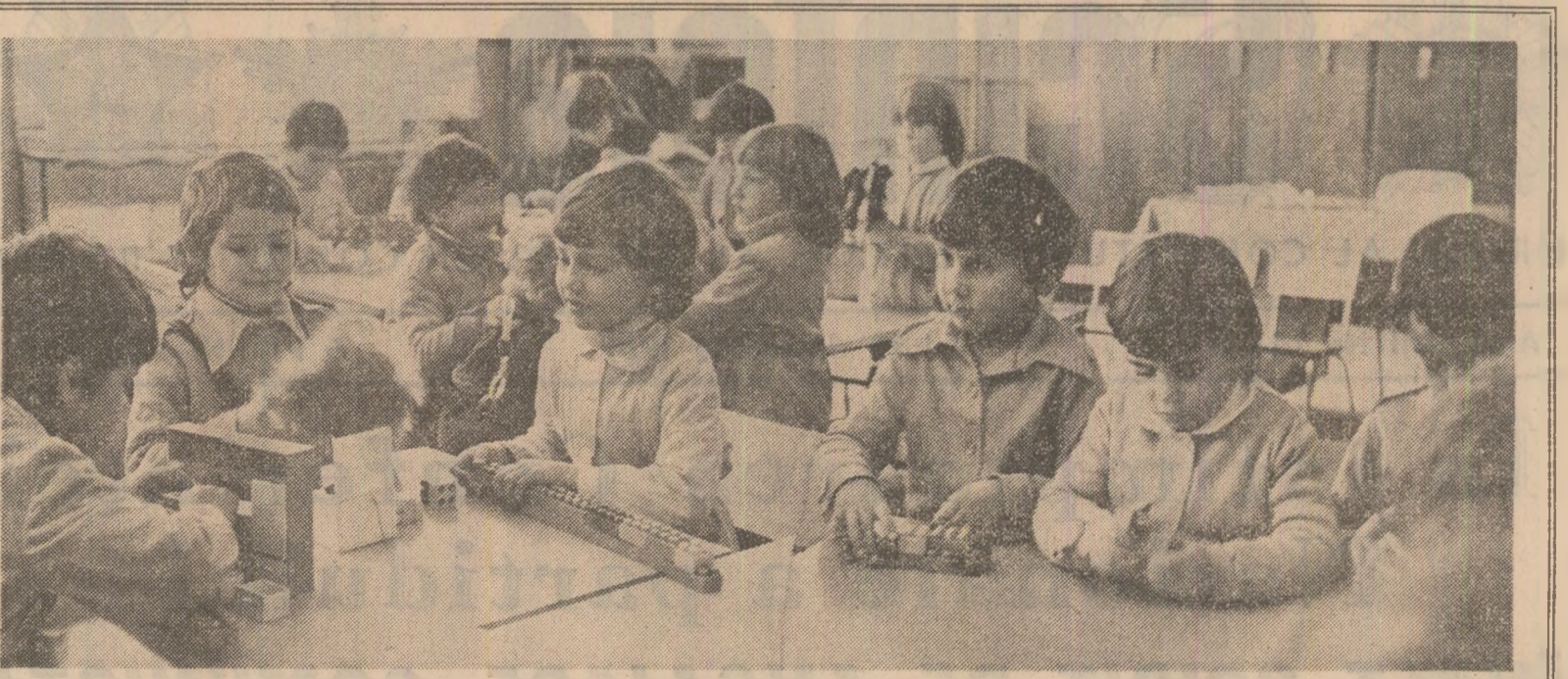
La grădinița nr. 3 cu program prelungit din Aiud

● Cu urmare, astăzi, 99 LA SUTA din copii vin pe lume într-o unitate spitalicească sub completă supraveghere medicală. ● Toate cele 3.878 DISPENSARE MEDICALE, existente în localitățile țării, la orase și sate, dispun de cabinete de specialitate pentru asistența medicală gratuită a copiilor. ● PESTE 7.000 DE MEDICI — pediatri și de medicină generală — pentru copii, 21.000 DE SURORI DE PEDIATRIE și circa 3.800 SURORI DE ÎNCĂLZIRE și încălzire și abnegație activitate îngrijirii sănătății copiilor.