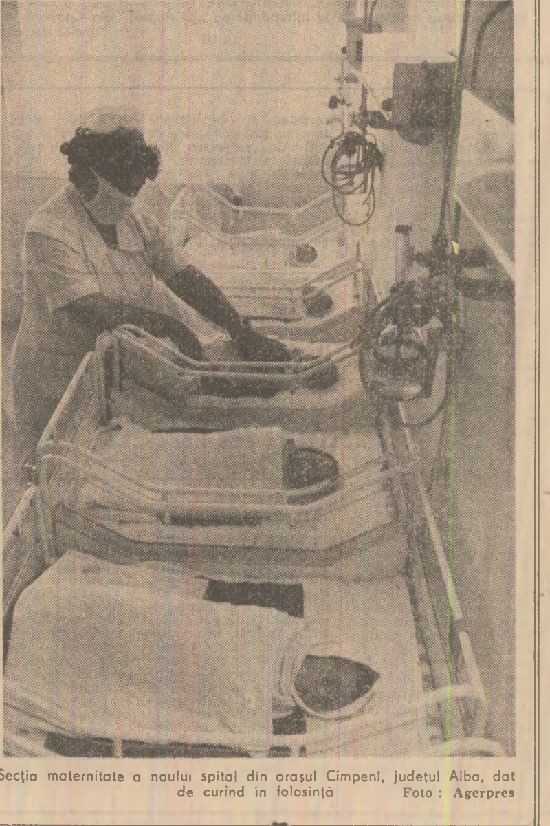
Secția maternitate a noului spital din orașul Cîmpeni, județul Alba, dot de curînd în folosință

● PESTE 7.000 DE MEDICI — pediatri și de medicină generală — pentru copii, 21.000 DE SURORI DE PEDIATRIE și circa 3.800 SURORI DE ÎNCĂLZIRE și încălzire și abnegație activitate îngrijirii sănătății copiilor.