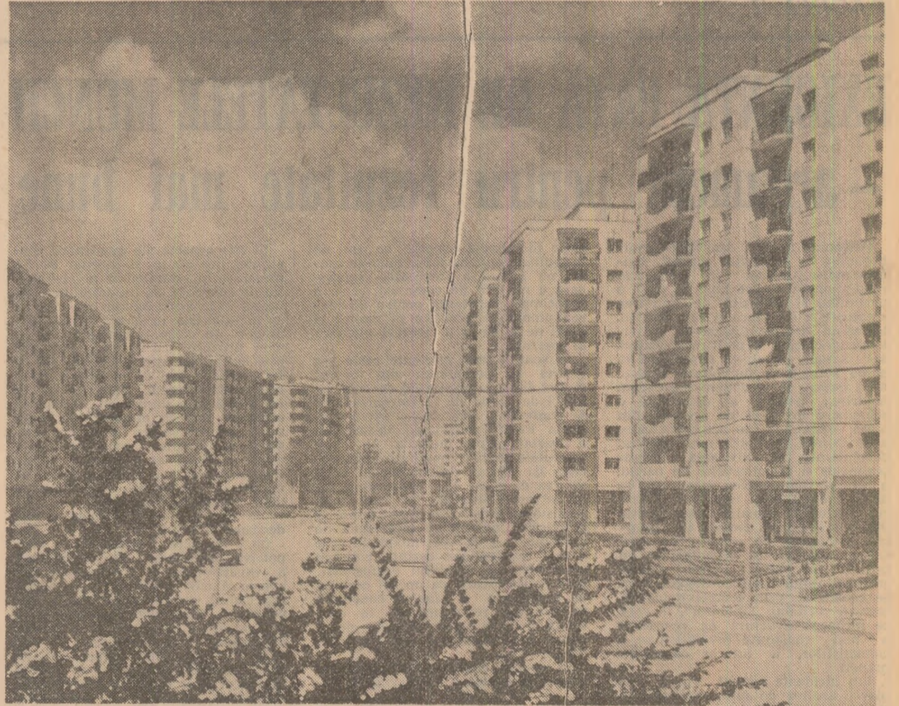
Din noul peisaj al Capitalei: construcții de locuințe pe Calea Văcărești