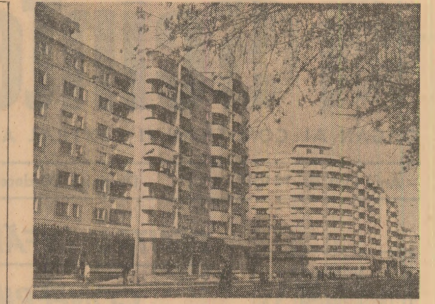
Din noua arhitectură a municipiului Brăila

„de interes național, încît să se creze de mișcare de masă, un euren larg, activ, în toate zilele anului. De aceea, de comun acord cu întreprinderea de profil, am stabilit permanent o acțiune de recuperare extinzînd aria lor de cuprindere în toate zonele municipiului. Similar vom proceda și în alte domenii, pentru a nu mai lăsa să se creeze „goluri” sau pauze în activitatea gospodărească a cetățenilor. „În acest sens, o altă concluzie pentru stilul nostru de muncă este aceea că organismele obiective — comitetele de cetățeni, asociațiile de locatari — să funcționeze nu numai