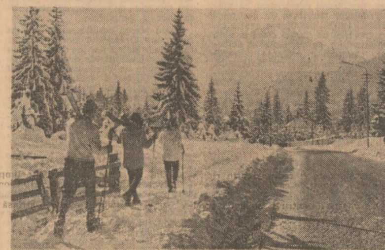
Cu schiurile, în muntii Bucegi.