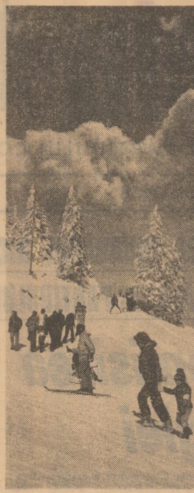
Cu schiurile, în vacanță