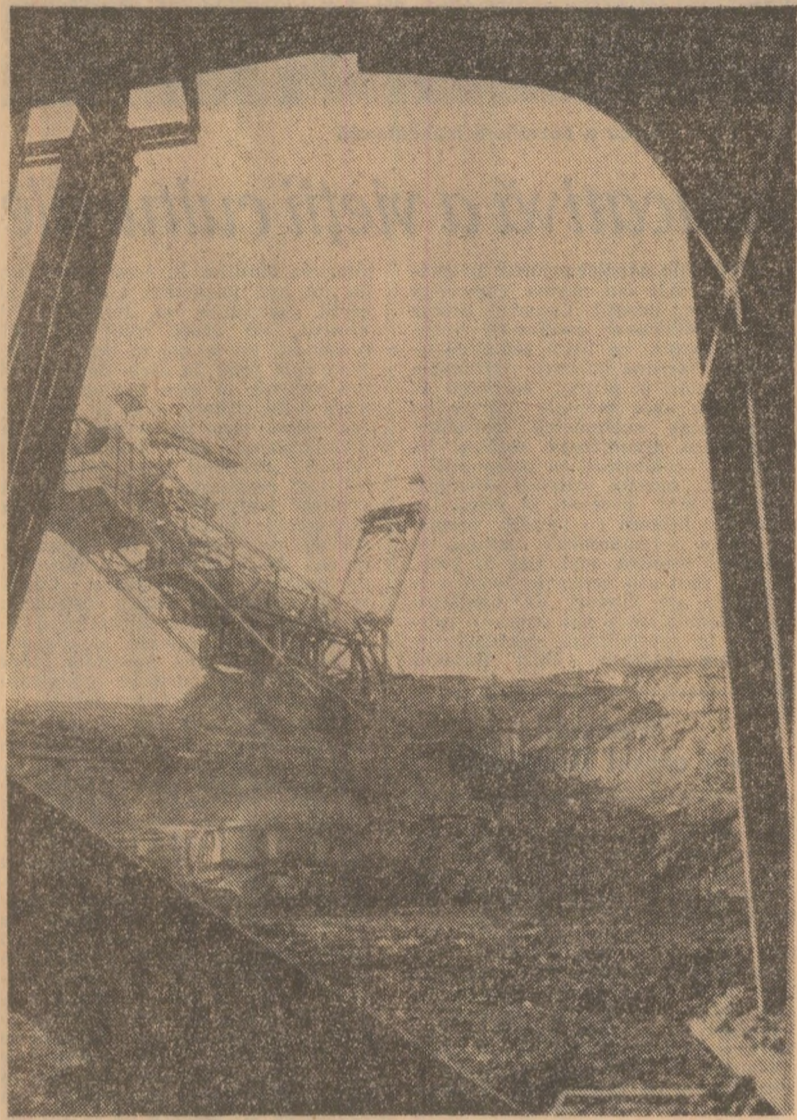
Bazinul carbonifer Berbești — Alunu