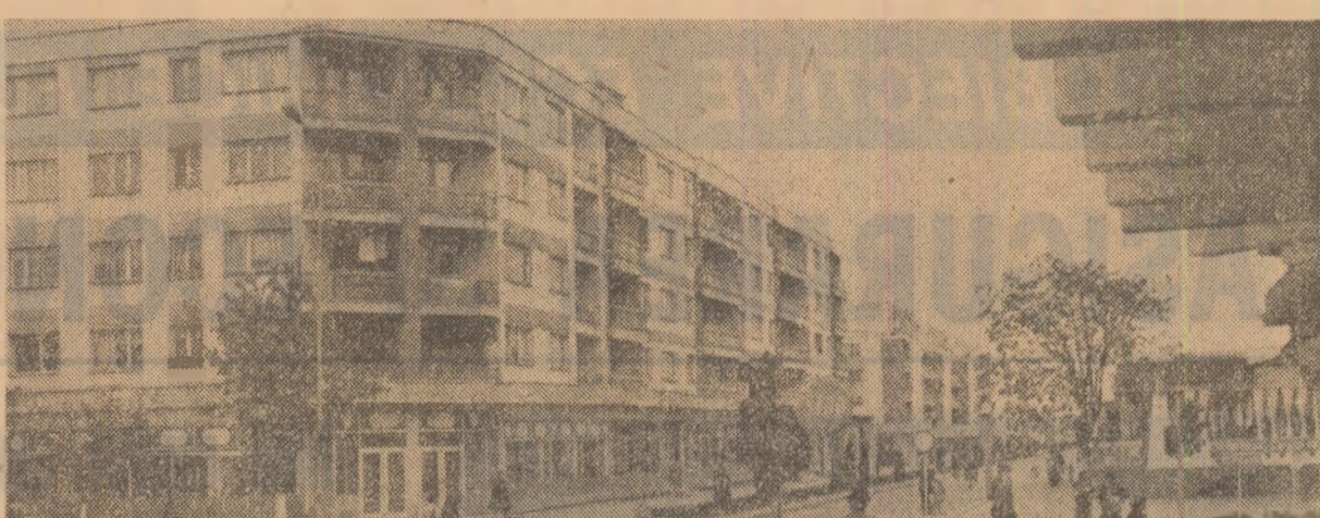
Drăgășani — un oraș cu o dezvoltare multilaterală