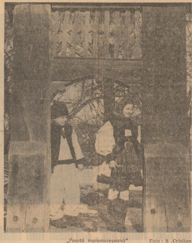
„Poartă maramureșeană”

Prof. Silvia CIOBANU Școlă cu clasele I-VIII nr. 202, București