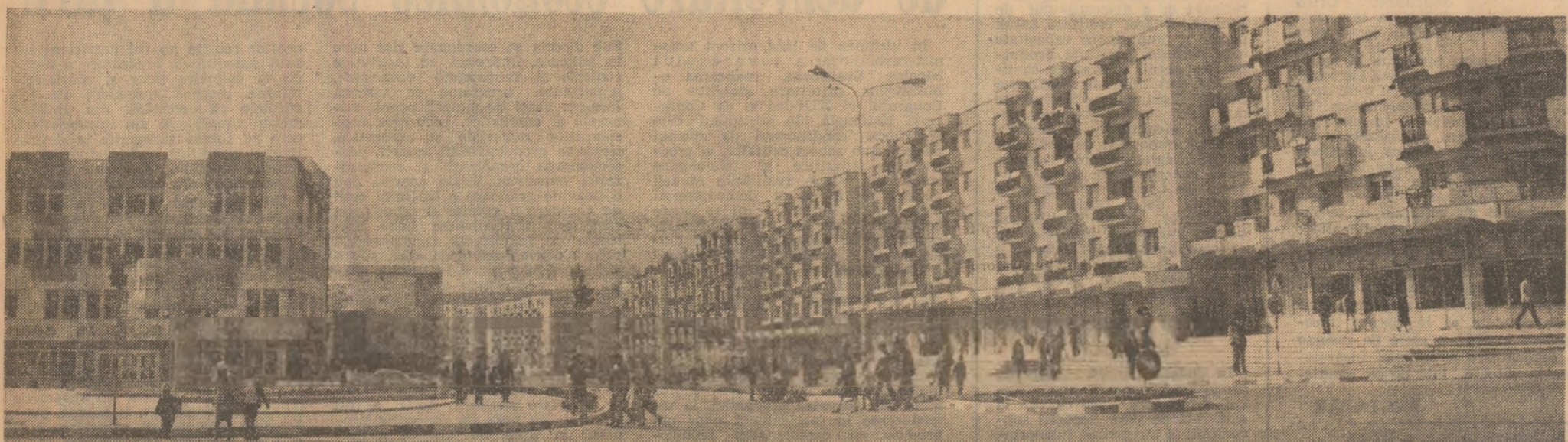
Județul Suceava. Imagine din Fălticeni, oraș în plină dezvoltare

Creația tehnică este o rezultatul a unui sumum de factori, conjugarea fericită a unor acțiuni organizatorice, politice, de informare, educative etc. Așa cum rezultă și din relațiile de față, esențial este ca organele și organizațiile de partid să țină în permanentă seama de această lucră, să coordoneze într-o viziune unitară de la gospodăria care pășune la fiecare loc de muncă să se creeze un climat deschis noului, o atmosferă propice creației tehnice.