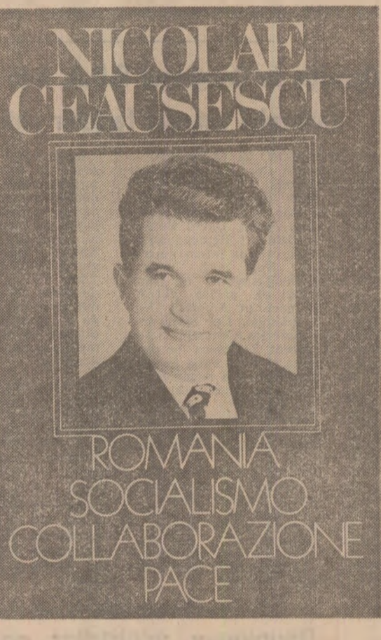
ROMANIA SOCIALISMO COLLABORAZIONE PACE

„Au participat membri ai conducerei grupului parlamentar de prietenie Marea Britanie — România, reprezentanți ai vieții economice și culturale britanice.“