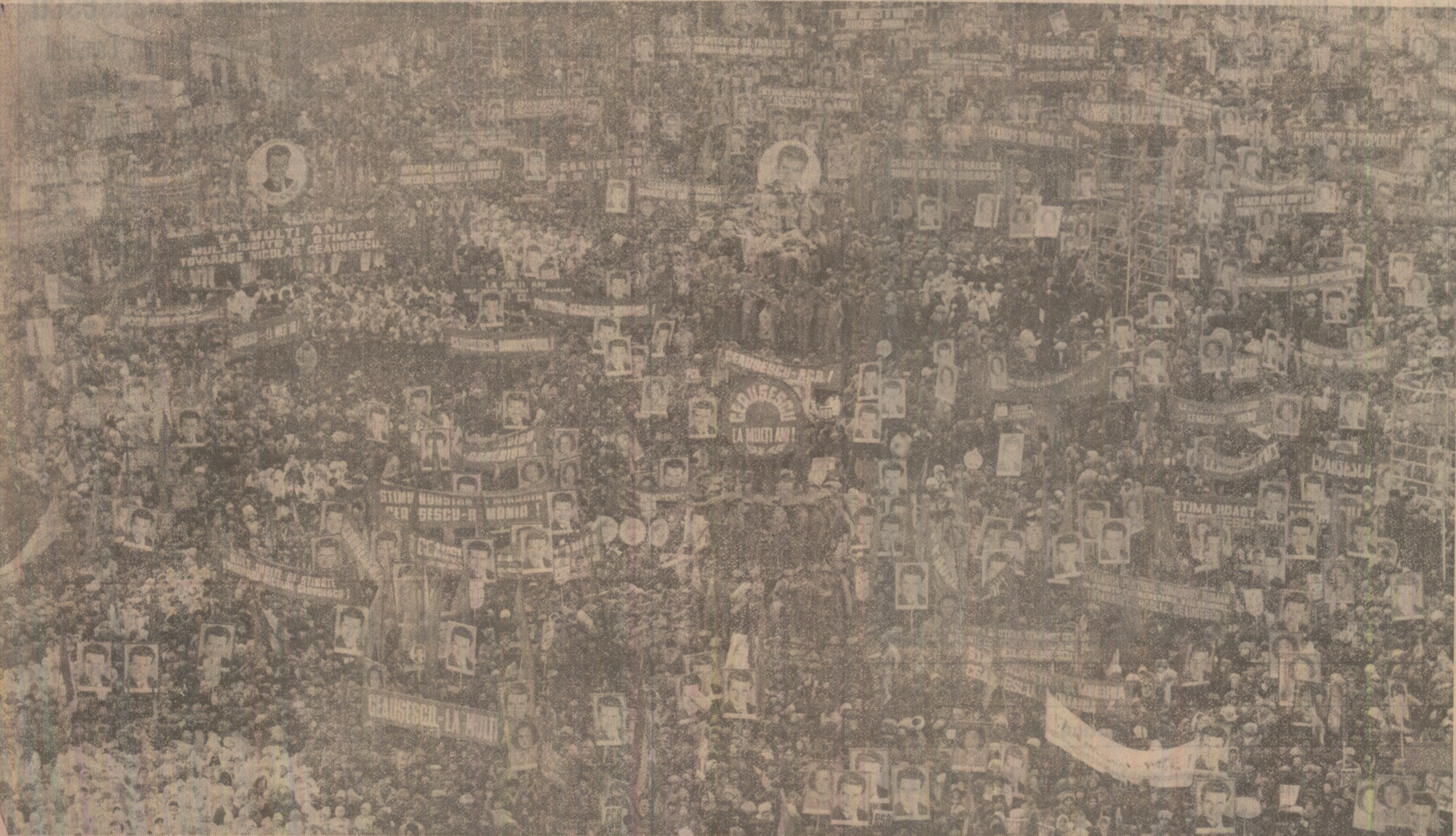
Într-o atmosferă de mare sărbătoare, de neșămurită bucurie, zeci de mii de locuitori ai Capitalei și-au exprimat, în Piața Republicii, sentimentele lor de dragoste, stimă și recunoștință față de Eroul națiunii, tovarășul Nicolae Ceaulescu, adresându-i cele mai calde urări de „La mulți ani!”