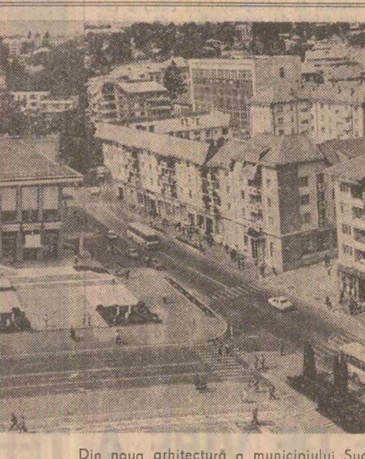
Din noua arhitectură a municipiului Suceava