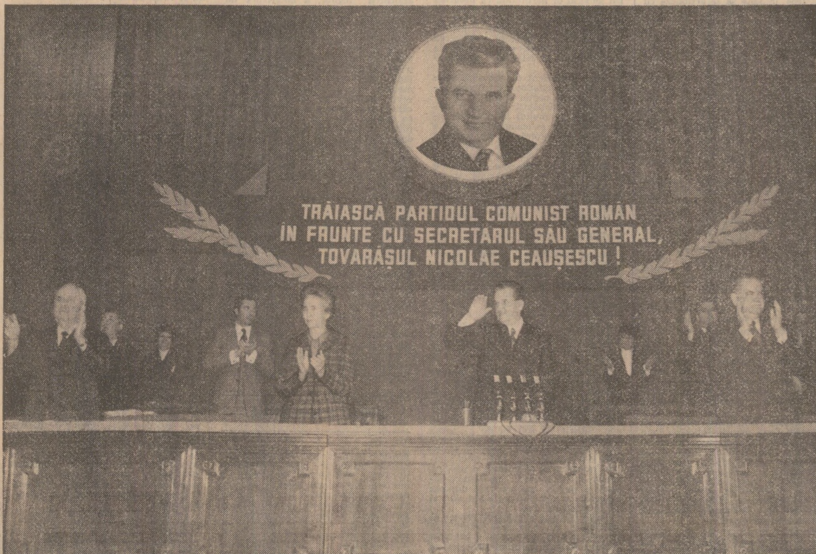
TRĂIASCĂ PARTIDUL COMUNIST ROMÂN IN FRUNTE CU SECRETARUL SĂU GENERAL TOVARĂȘUL NICOLAE CEAUȘESCU!

Sub președinția tovarășului Nicolae Ceaușescu, secretar general al Partidului Comunist Român, președintele Republicii Socialiste România, președintele Consiliului Național al Oamenilor Muncii, joi, 4 februarie, au început, la Sala Palatului Republicii, lucrările plenarei Consiliului Național al Oamenilor Muncii.