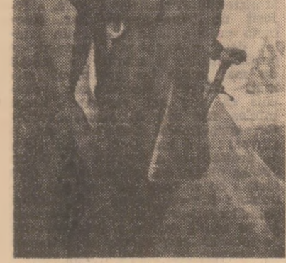
THEODOR AMAN: Tudor Vladimirescu

Unitatea şi libertatea României, independenta ei, au constituit adevăratele prieteni de meditaţie no doar pentru artiştii revoluţiei de la 1848, ci şi pentru toţi artiştii adevăraţi care au scris cu mijloacele artei lor istoria culturii româneşti moderne şi contemporane. Şi altele în minte, în înaltă tensiune ale înclăştării revoluţionare, intensitatea fierbinte a apeliului afectiv şi-a găsit exprimarea pe măsură, limbajul clar şi hotărât capabil să mobilizeze masele. „Revoluţia a intrat în sufletul meu”, obişnuia să spună C.D. Rosenthal, creatorul care, desi se stîngea la muma 31 de ani, a lăsat artei noastre imaginea antologică ale „României revoluţionare”, ale „României ruginii” — căsuşele pe Cimpia Libertăţii”, portretele lui Nicolae Bălcescu, Nicolae Golescu, Elena Negri.