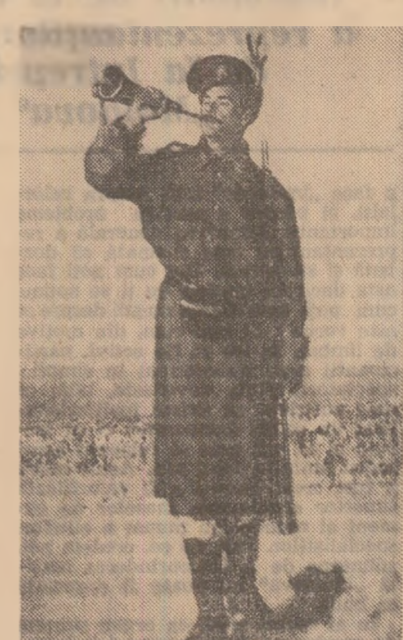
NICOLAE GRIGORESCU: Gornitul

„Destepărea României” de George Tatarescu, autorul deopotrivă al celui mai cunoscut portret al lui Nicolae Bălcescu, sint şi altele, exemple de gândire şi acţiune care au înaintat de prestigiu. Subliniind această idee de preţioasă participare la viaţa întregului popor, Alexandru Vlahtu, unul din mari prieteni ai lui Nicolae Grigorescu şi unul din primii exegeţi ai opereii sale, scria referindu-se la altitudinea picturii în luptele pentru distigenţa independentă: „În rînd cu soldaţii, înfruntînd moartea, a privit de aproape toate atrocităţile războiului, a înţeles cine sînt adevăraţii eroi, şi lor le-a închinat toată iubirea şi toată admiraţia sufletului; pe ei, pe opincarii aceia uscaţi şi vinjoşi, care se vîrlează cu frenezii în braţele morţii, pe ei mai ales i-a nemurit în puternica lui operă, cea mai mîscătoare epopee a vîlceii neamului nostru”. De atunci s-a scris mult desluşit, cu carea, învîntăm omni de cultură, oferim asistenţă metodică. Necesităţile sînt însă mai mari decît posibilităţile noastre.