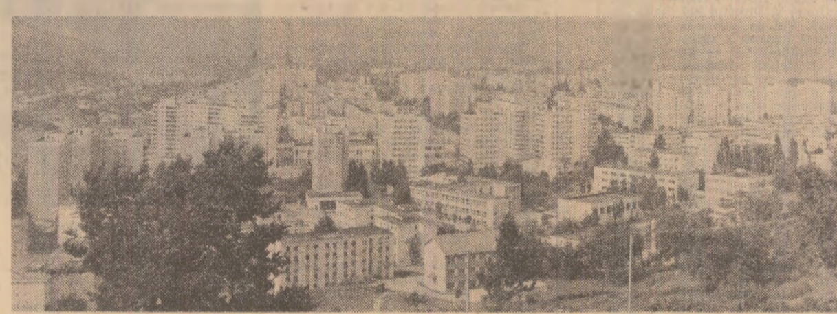
Piatra Neamț azi - un oraș modern, în inima unui județ în plină dezvoltare