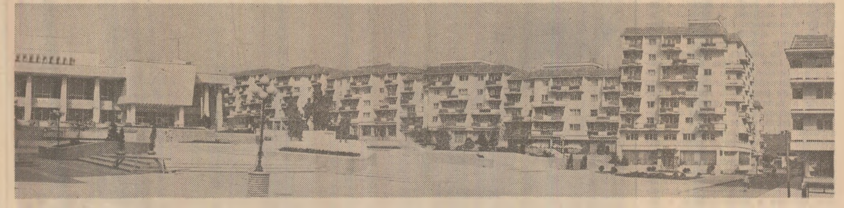
Sfîntu Gheorghe — un oraș modern, în continuă dezvoltare