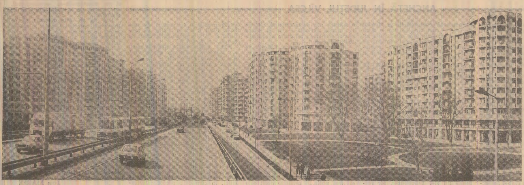
Noi construcții de locuințe în cartierul Cîrșăși din Capitală.

Hotărîri să îndeplinească exemplar sarcinile de plan pe acest an și pe întregul cincinal, oamenii muncii din cadrul Trăstăriei de foraj-extracție „Boldesti-Sciari” realizează depășirea prevederilor la producția fizică pe primele două luni ale anului. Astfel, prin aplicarea activității de foraj a fost depășit șchelele predind în avans producției încă trei sonde noi. (Ioan Marinescu).