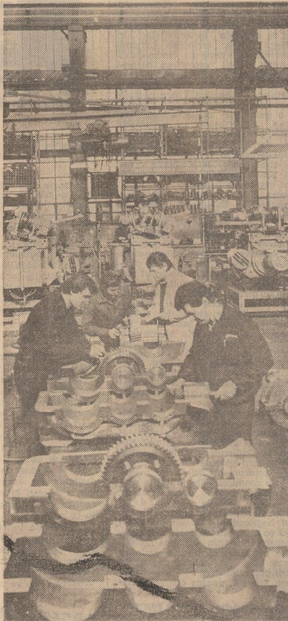
În secția montaj reductoare a întreprinderii de utilaj-minier din Satu Mare.