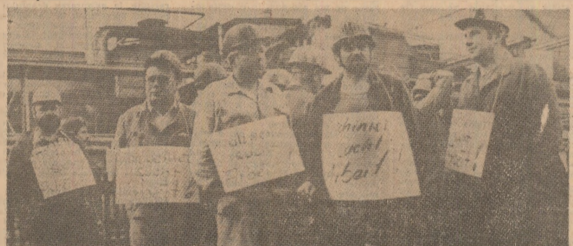
Muncitorii metalurgiști de la uzina Maxhütte din Sulzbach-Rosenberg (R.F.G.), amenințați cu concedierea...