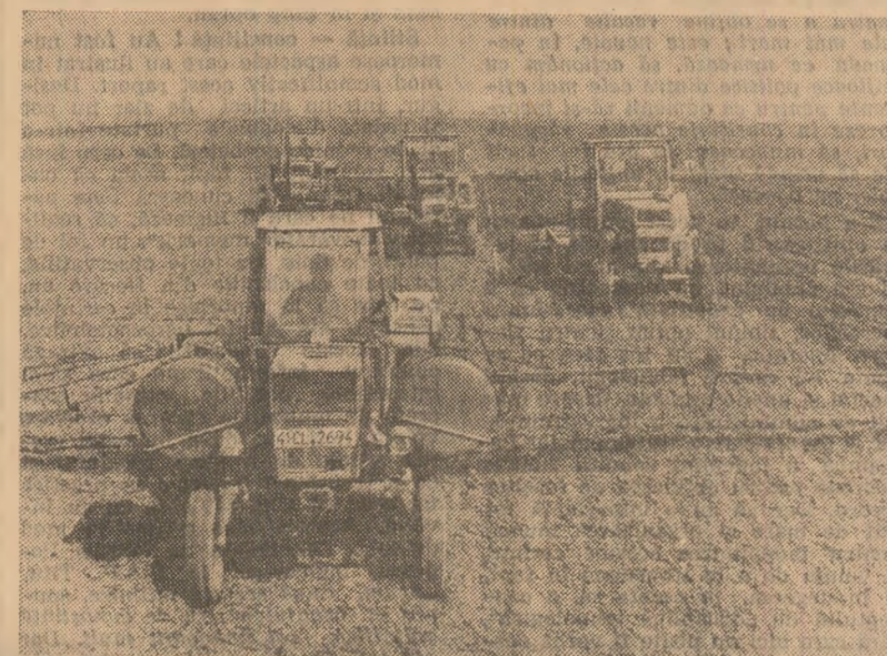
Dimineața în zori se pregătește terenul pentru însumătura porumbului la I.A.S. Jegalia, județul Călărași