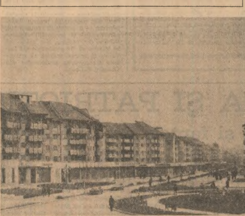
Arhitectură modernă la Petroșani

În aceste zile, numărul locuințelor construite și puse la dispoziția cetățenilor în actualul cincinal se ridică la aproape 5.000, iar cele construite pe ansamblu județului, în ultimile două decenii se cifrează la 65.000. De remarcat că o mare parte din apartamentele date în folosință în ultima perioadă au un grad sporit de confort și au drept sursă de încălzire și de asigurare a apei calde menajere agenți termici secundari recuperari de la instalațiile industriale, cu descriere de la combinațele chimice din Tirgu Mures și Tîrnăveni. (Gheorghe Giurgiu).