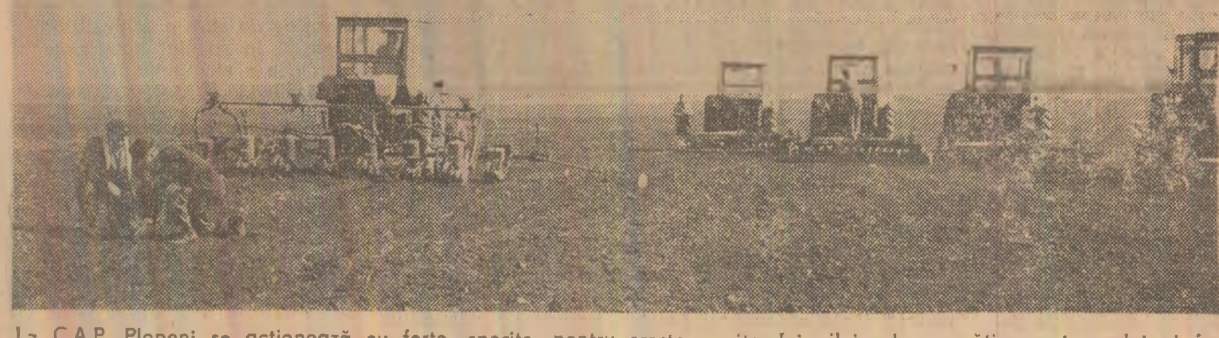
La C.A.P. Plopieni se acționează cu forțe sporite pentru creșterea ritmului zilnic de pregătire a terenului și însămînțarea porumbului.