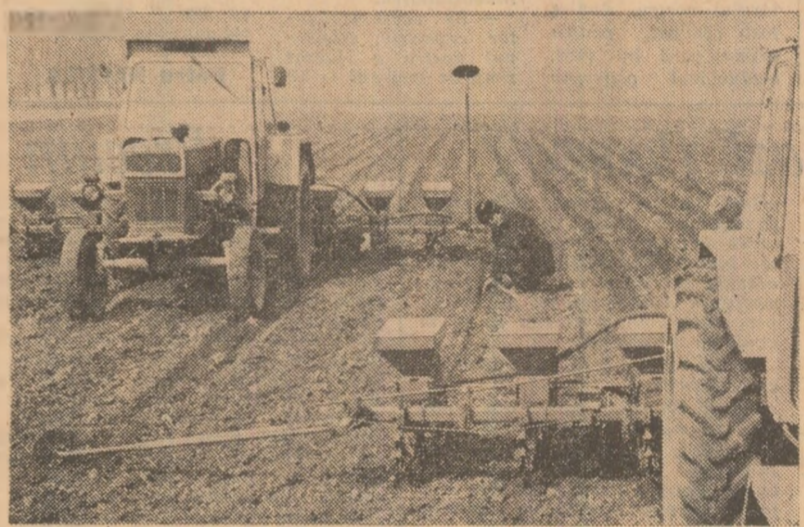
La C.A.P. Sibioara, ca și în celelalte unități agricole constănțene, se acordă cea mai mare atenție calității semănăturii.