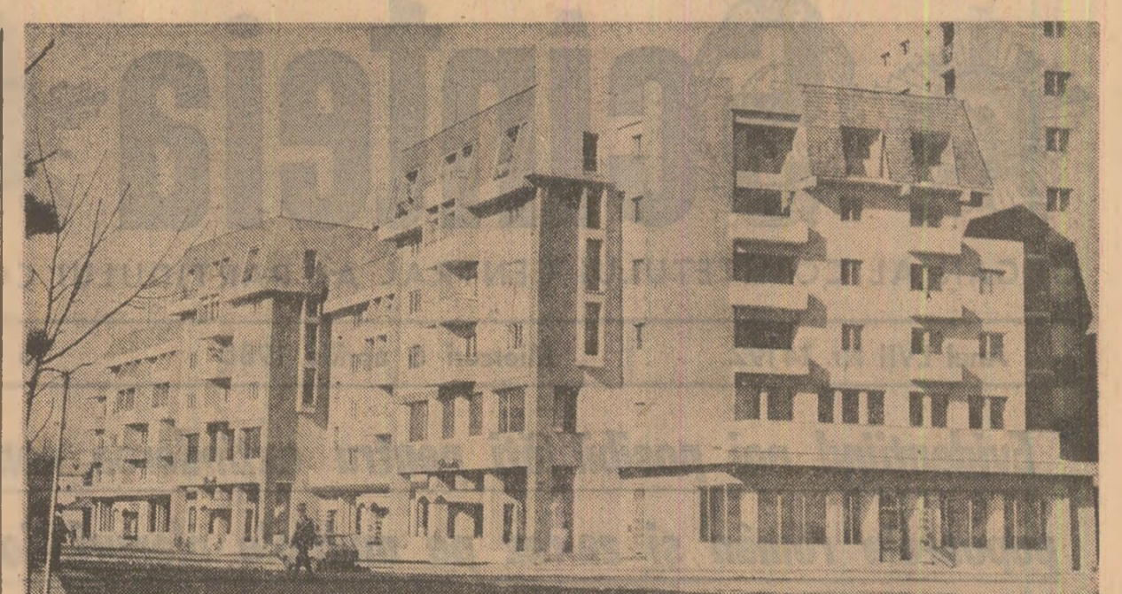
Turnu Magurele, azi