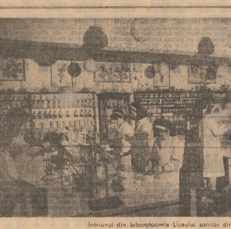
Intr-unul din laboratoarele Liceului sanitar din Capitala