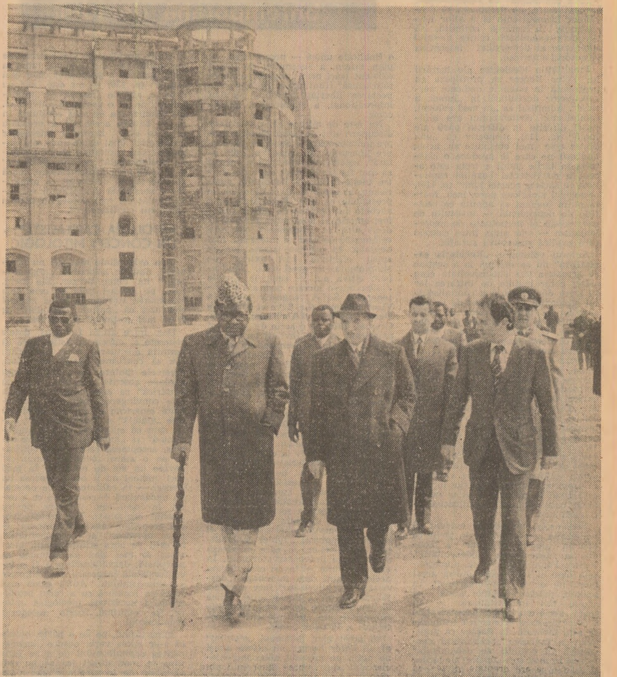
Oaspetele a fost însoțit de tovarășul George Rădulescu, vicepreședinte al Consiliului de Stat. Președintele Republicii Zair i-au fost prezentate tractoare, combine și alte mașini agricole, cele mai noi tipuri și variante de autoturisme de oraș și de teren „Dacia”, „Oltcit” și „ARO”, precum și gama diversă de automobile, autobuze, autobuscule, autostierere. Semnând în cartea de onoare, șeful statului zair a apreciat realizările obținute de specialiștii români în domeniul construcțiilor de mașini și le-a urat succesul tot mai mare în activitatea lor viitoare.