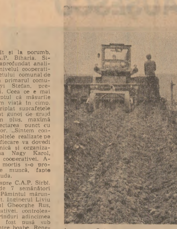
În județul Galati se acționează energic în vederea asigurării unei producții sporite de cartofi. În fotografie: aspect de muncă la C.A.P. Șciitiei.

Timp de două zile, în județul Arad s-au semănat mai bine de 20.000 hectare. Este o suprafață apreciabilă, dacă avem în vedere că nu s-a putut lucra în toate unitățile din județ. Dar, așa cum s-a procedat tot timpul în această campanie de primăvară, sub îndrumarea organe- lor și organizatorilor de partid, a orga- nelor de specialitate, lucrătorii ogazilor acționează cu prompti- tudină, imediat ce condițiile agrome- teologice permit acest lucru. Iar dacă într-o cooperativă agricolă nu se poate semăna sau pregăti terenul, forțele mecanice sînt dirijate spre unitățile învecinate. O asemenea si- tuație am intîlnit în consiliul agro- industrial Cermel. La C.A.P. Săpures, de exemplu, lucrăm luni la pregătire- a terenului și la semănat, peste 90 de tractoare. Rezultatul: pînă în seara zilei respective s-a semănat porumb pe circa 200 hectare și s-a