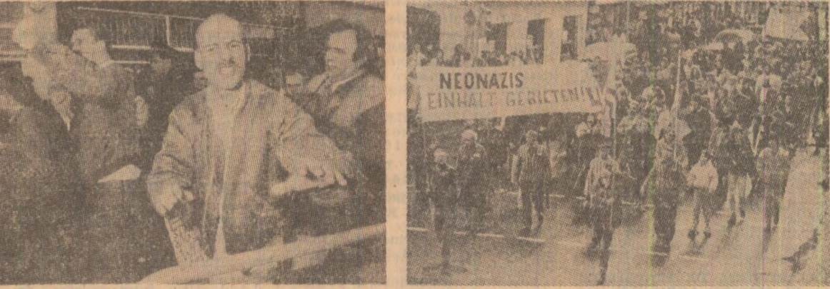
Revista „Newsweek” reproduce, între altele, două secvențe semnificative: o demonstrație organizată de Frontul Național din Marea Britanie împotriva imigranților (imaginea din stînga), pe care-i acuza a fi violenți pentru nivelul înalt al șomajului, precum și un marș de protest în R.F. Germania (imaginea din dreapta), în cadrul căruia participanții s-au pronunțat împotriva organizațiilor neofasciste, chemînd opinia publică „să nu uite lecțiile istoriei”

Neofasciștii din țările respective își dau mîna peste frontiere. Trei teroriști italieni, căuții de poliție în legătură cu distrugerea șării centrale din Bologna, în 1980, se pare că stau în siguranță în locuțiile din Londra asigurate de Frontul Național din Anglia. În fiecare an, în ultima duminică din luna iunie, neofasciștii se întînesc în stîlul Diksmuide din Belgia, alșevse pe nazisti căuții în cel de-al doilea război mondial, mărșăluiesc în uniforme hitleriste și consumă oceane de bere flamandă.