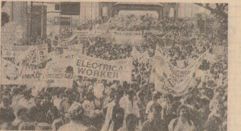
În apărarea dreptului suprem la pace, la viață, se ridică, pe toate continentele, milioane și milioane de oameni. Imaginea de mai sus surprinde o secvență de la impresionantul marș pentru pace desfășurat recent în orașul Vancouver din CANADA. Strîns unii, păsesc alături oameni din cele mai diverse categorii sociale, avînd concepții politice și filozofice diferite, țelul care-i unește în lupta lor este apărarea păcii, trecerea la noi măsuri de dezarmare, făurirea unei lumi fără arme și fără războaie

În GRECIA au loc numeroase demonstrații împotriva prezenței