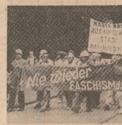
„Niciodată și nu mai fie fascism, niciodată și nu mai fie război!”; „Fasciști - afară din nostru!”

Ziua solidarității internaționale este în același timp o zi de acțiune