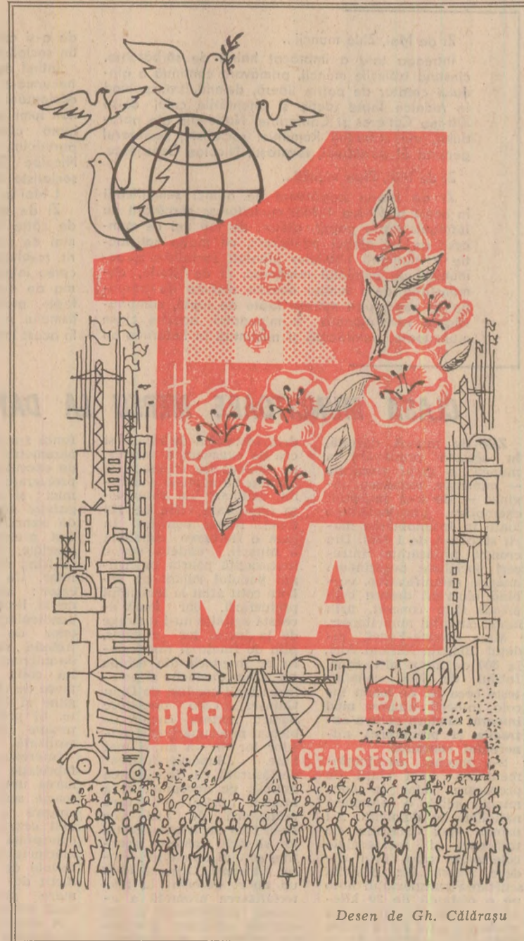
Desen de Gh. Căldărășu

Și cu atît mai limpede se impune faptul că această hotărîtoare bătălie a prezentului, sub semnul căreia sărbătorim astăzi munca dăruită și creatoare pentru înflorirea patriei, continuă peste timp și încununează aspirațiile și idealurile înalte, bogatele tradiții de muncă și de luptă ale clasei muncitoare din România. Munca de calitate, lucrul bine făcut, „miinile de aur” s-au aflat întodeauna la marcă cîștigătoare, în condițiile muncii moderne dotate cu cele mai perfecționate unelte care au înlocuit truda silnică de odinioară, există cele mai favorabile auspicii pentru deplina afirmare a inițiativei muncitorești, pentru promo-