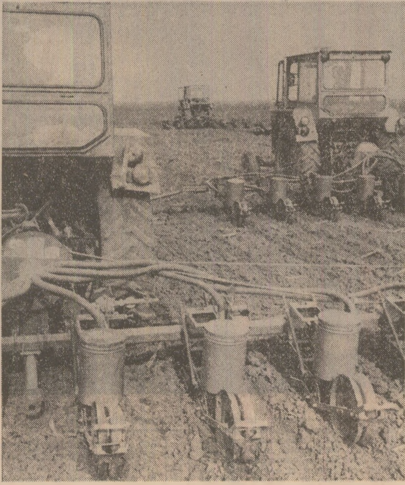
Acum, cînd vremea este bună pentru semănat, ritmul lucrărilor trebuie mult intensificat, mai ales în unitățile rămase în urmă.

ALBA. În urmă cu cîteva zile, comandamentul județean pentru agricultură a stabilit măsura, pentru reluarea lucrărilor agricole întrerupte de vremea nefavorabilă,