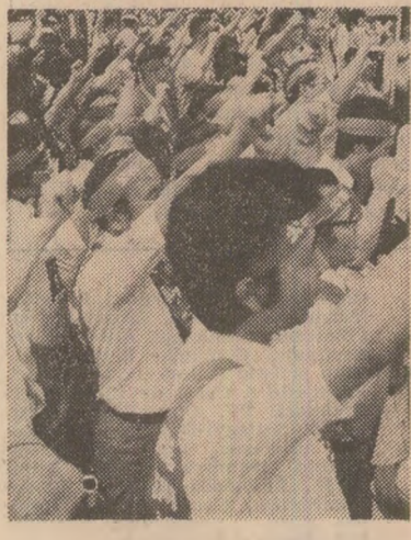
În această primăvară, în JAPONIA s-a desfășurat o semnificativă manifestație - „Caravana împotriva șomajului”. Această acțiune a pornit concomitent din nordul și sudul țării, pentru ca, în final, coloanele de manifestații să se întâlnească la Tokio

comună împotriva recrudescenței provocărilor neofasciste - a fost izbucnită în unele țări din Europa occidentală. În fața ofensivei extremiste drepte, care a câștigat teren în FRANȚA, luind act de declarația grupării extremeiste „Frontul Național”, de a organiza contra-demonstrații de 1 Mai, mișcarea muncitorească și sindicatul a lansat apelul la întărirea unității de acțiune; s-au alăturat apelului numeroși intelectuali, foști membri ai formațiunilor din Rezistența împotriva fascismului, asociații de femei și tineret. Pe străzile Parisului se vor desfășura la 1 Mai marșuri de protest, unul dintre acestea între Piața Bastiliei și Piața Operei, foarte aproape de locul unde au anunțat că se vor aduna elementele neofasciste.