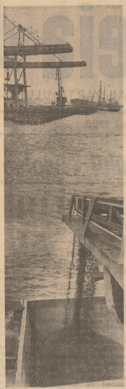
Imagine din noul port Constanța-Sud

Gheorghe CIRTEA correspondentul „Scintei”