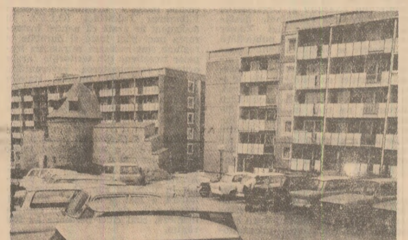
Noul cartier Häselburg coexistă cu resturile vechiului zid de apărare al orașului Gera