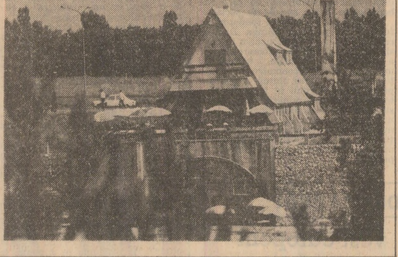
În fotografie: Popasul turistic „Scornicești” din județul Olt.