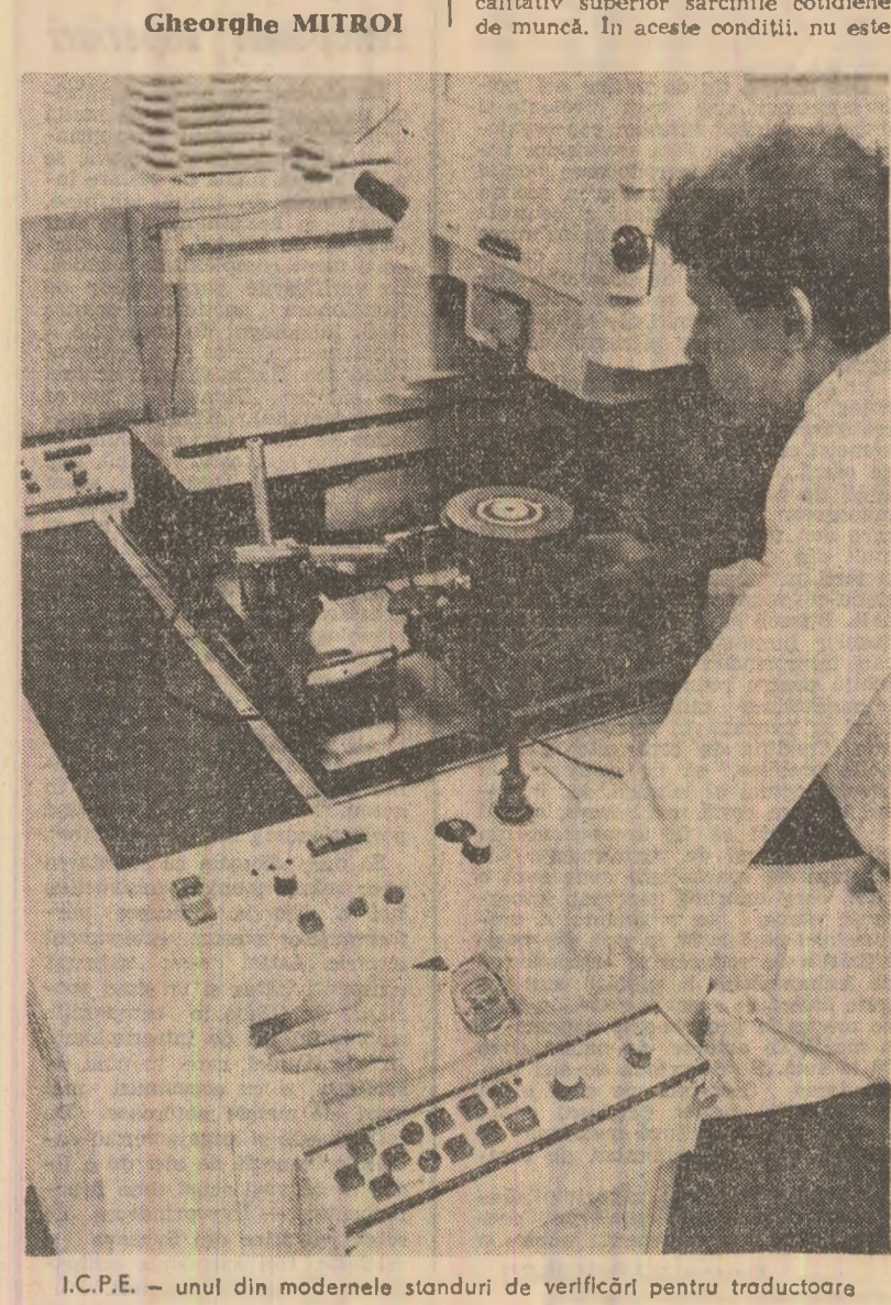
I.C.P.E. — unul din modernele standuri de verificare pentru traductoare