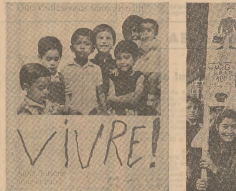
La întrebarea: „Ce vă doriți pentru ziua de mîine?” — un răspuns cu valoare de simbol: „Să trăim în! (Alțiș editat de Consiliul Mondial al Păcii)