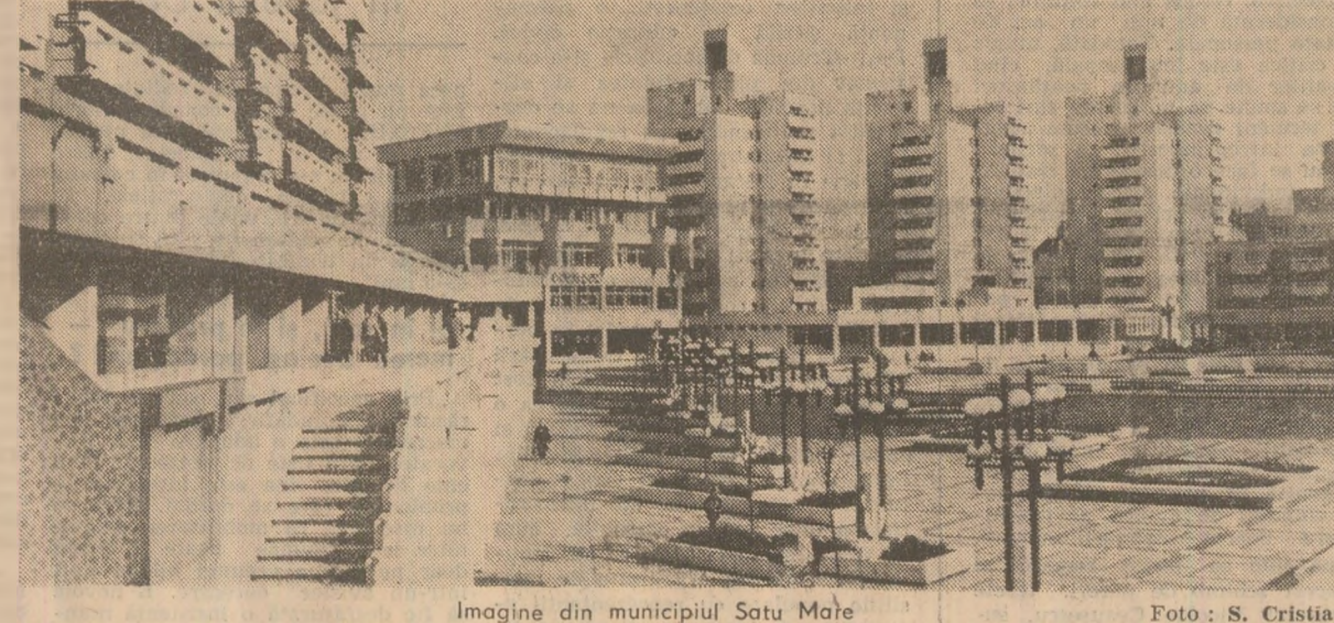
Imagine din municipiul Satu Mare

Aplicând tehnologii moderne de manipulare a mărfurilor, cum ar fi paletizarea, pachetizarea, containerizarea și altele, docherii și mecanizatorii celor 7 întreprinderi de exploatare portuară din Constanța au realizat, de la începutul anului și până în prezent, un trafic suplimentar față de prevederile de plan de 700 000 tone. La danele portuare se adăugă în prezent, sub operațiunile de încărcare și descărcare, aproape 60 de nave românești și străine, multe dintre acestea preluând la bord luminare, autoturisme, instalații și echipamente industriale, genuri și alte mărfuri românești destinate exportului. (George Mihaescu).