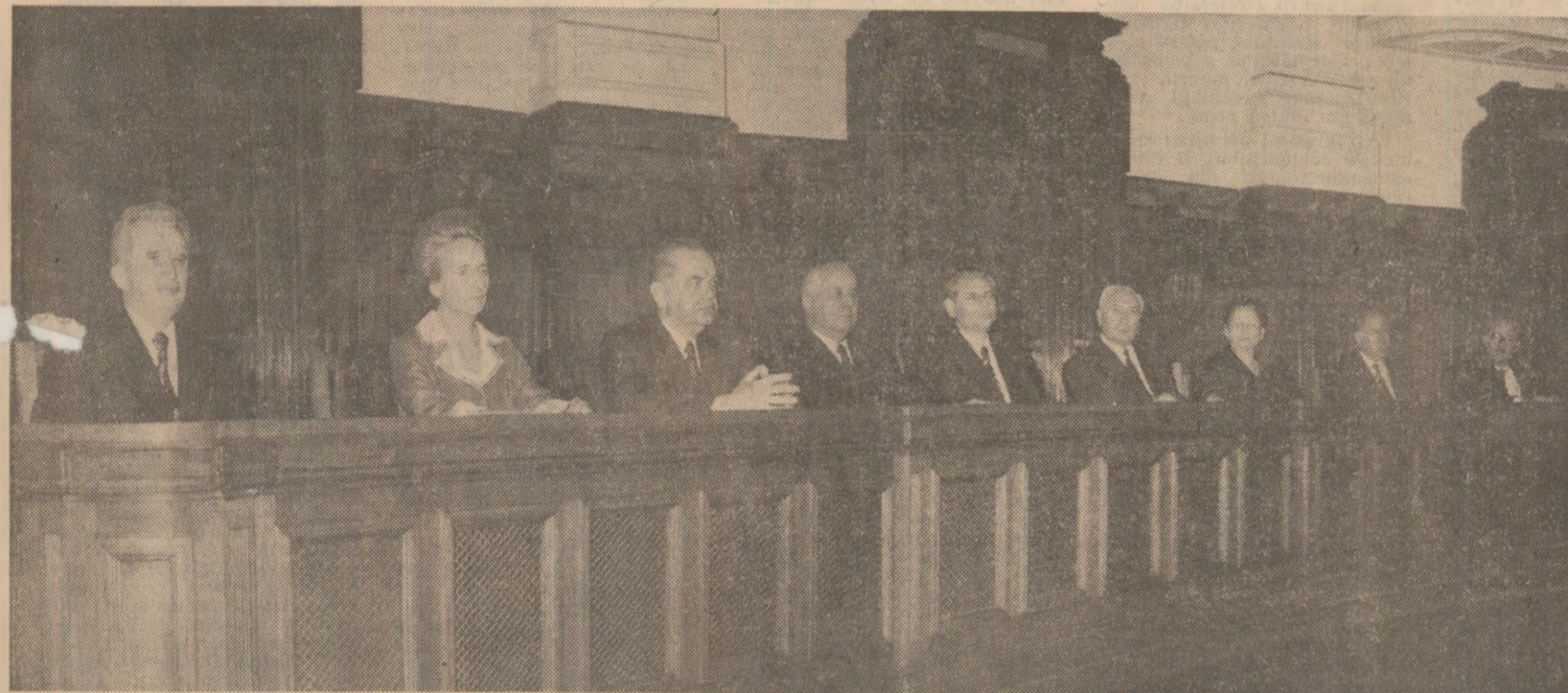
In prezența tovarășului Nicolae Ceaușescu, secretar general al Partidului Comunist Român, președintele Republicii Socialiste România, miercuri, 29 iunie, au fost reluate în plen lucrările sesiunii a VII-a a celei de-a IX-a legislaturi a Marii Adunări Naționale.

La sosirea în rotunda Palatului Marii Adunări Naționale, tovarășul Nicolae Ceaușescu, tovarășa Elena Ceaușescu au fost întâmpinați cu deosebită căldură, cu sentimente de aleasă stimă și prețuire, deputații, toți cei prezenți ovaționând îndelung pentru partid și secretarul său general.