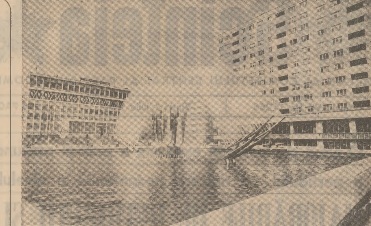
Din noua arhitectură a municipiului Drobeta-Turnu Severin

de consum din puțin decît în anii precedenți. Cum s-a putut? Cînd toată munca a trecut sub imperativul raționalului, resursele s-au ivit imediat. În primul rînd, prin apropierea sedilor de punctele de lucru s-au redus enorm transporturile de personal. Apoi drumurile, după ce... un surub, și cite, și cite altele... Am făcut un regulament de folosire a fondului de investiții, noi am reușit să ne depășim planul de producție, și anul trecut și pe primele cincisute luni din acest an, fiecare unitate produc-