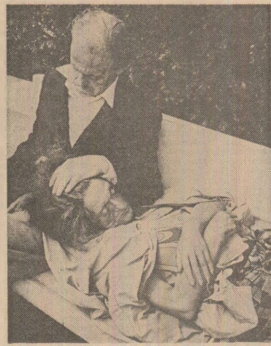
Cînd pensia nu poate acoperi chiria unei locuințe modeste, „soluția” rămîne refugiu pe o bancă din parc (Imagine dintr-un parc din Philadelphia, reprodusă după revista „Newsweek”)