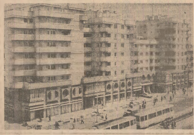
Craiova. La parterul blocurilor de locuinţe - magazine moderne.