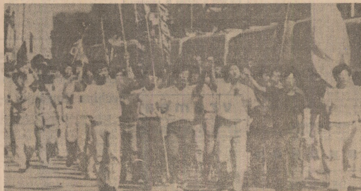
Studenți sud-coreeni au organizat, în apropierea liniei de demarcație, o impresionantă demonstrație pentru reunificarea pașnică a patriei