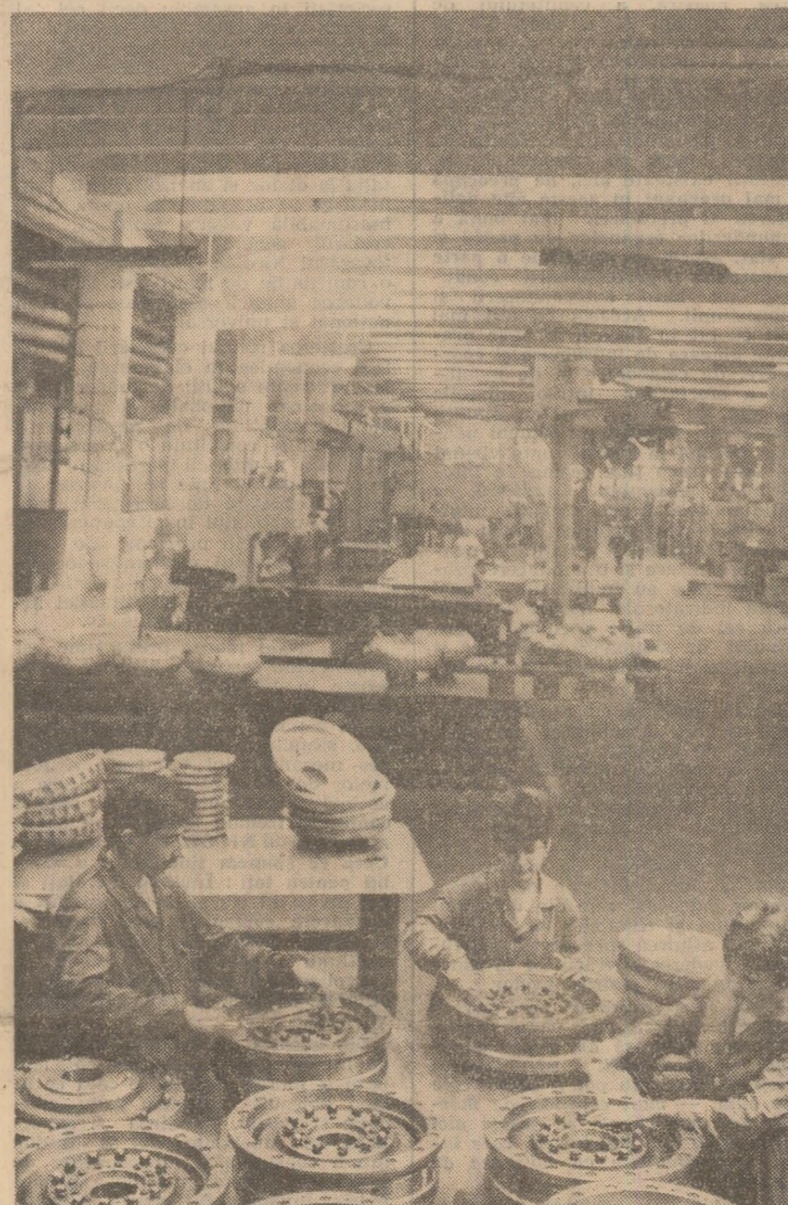
La Întreprinderea mecanică din Vaslui, care se numără printre puținele producătoare de servomecanisme, cuplaje hidraulice și ventilatoare industriale din țară, se acordă o atenție deosebită înnoirii și modernizării producției, a tehnologiilor de fabricație. Astfel, în secția mecanică II a fost pus la punct un sector de producție integrat pentru execuția cuplajelor electromagnetice pentru mașini-unelte, care asigură un spor anual de producție-mărie de peste 5 milioane lei. În fotografie: un nou lot de produse este verificat înainte de a fi expediat beneficiarului. (Petru Nețușă)