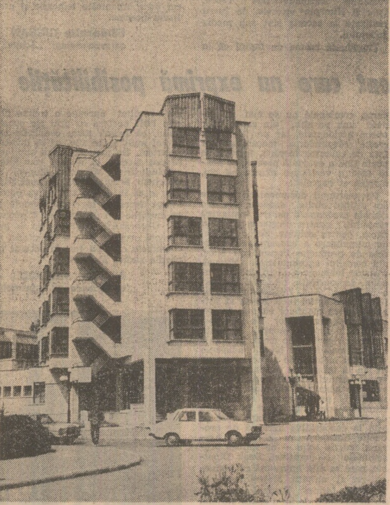
Casa de cultură, a științei și tehnicii pentru tineret din municipiul Bistrița