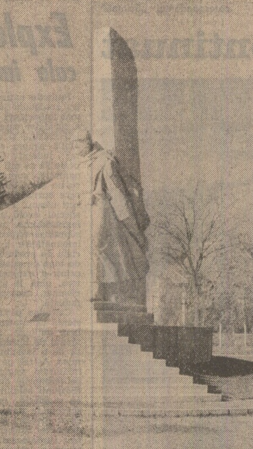
MONUMENTUL OSTAŞULUI ROMÂN (Baia Mare) - lucrare de Ostap Andrei