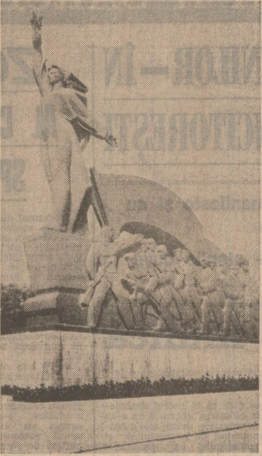
MONUMENTUL VICTORIEI (Constanța) - lucrare de Boris Caragea