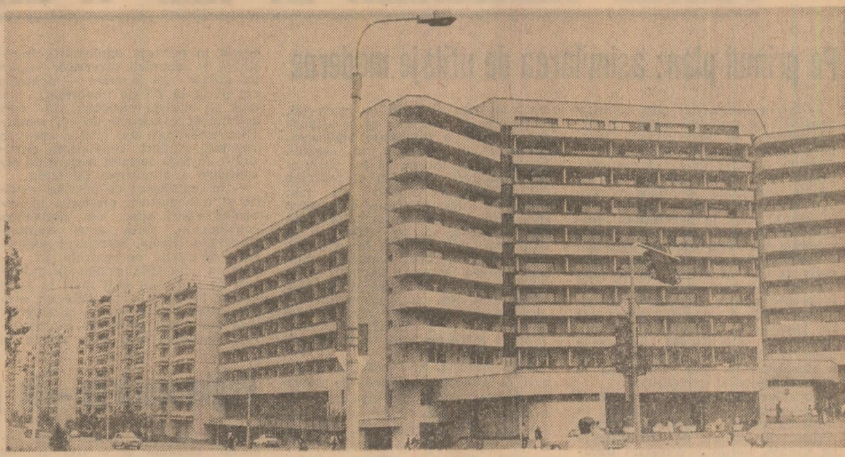
Locuințe moderne la Tirgu Mures