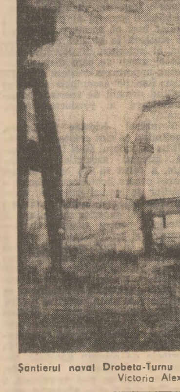
Șantierul naval Drobeta-Turnu Severin - lucrare de Victoria Alexiu