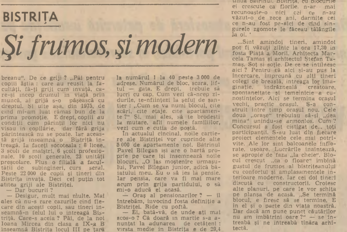
Armonioasă împletire a tradiției cu modernul intruchipată în noua arhitectură a municipiului Bistrița

„Se lasă amurgul. La consiliul popular municipal se aprind luminile. Ziua de muncă aici nu s-a terminat. Oamenii și edilii făuresc planurile Bistriței de mine. Își făuresc propria viață, o dată cu viața întregii așezări, a întregii țări. Laurentiu DUTA Gheorghe CRISAN corespondenți „Științei”