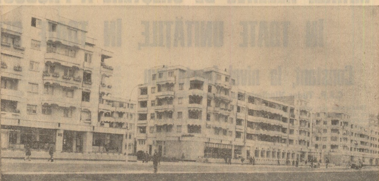
Construcții noi, moderne în municipiul Galați

Tovarășul Nicolae Ceaușescu, președintele Republicii Socialiste Române, împreună cu tovarășa Elena Ceaușescu, va efectua o vizită oficială de prietenie în Republica Kenya, la invitația președintelui Republicii Kenya, Daniel Toroitich arap Moi, în prima decadă a lunii septembrie 1988.