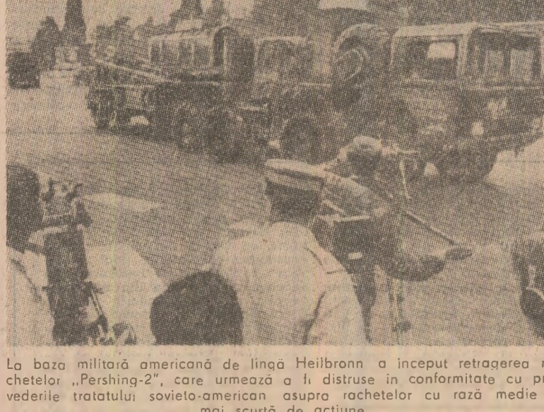
La baza militară americană de lângă Heilbronn a început retragerea rachetelor „Pershing-2”, care urmează a fi distruse în conformitate cu prevederile tratatului sovieto-american asupra rachetelor cu rază medie și mai scurtă de acțiune