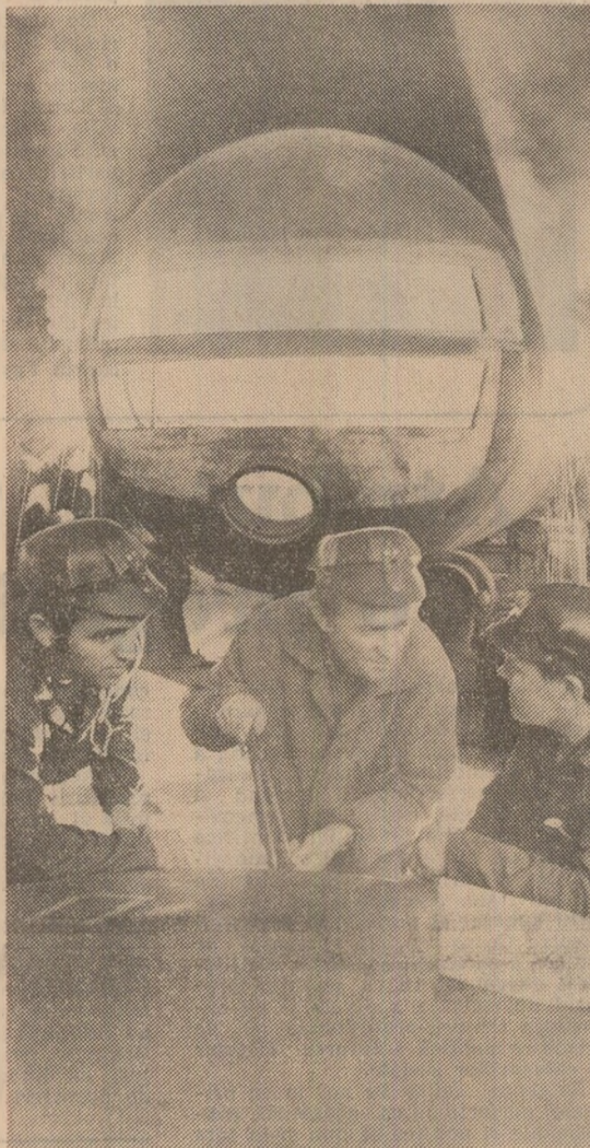
La întreprinderea „Vulcan” din Capitală UTILAJELE ENERGETICE — REALIZATE LA TERMEN