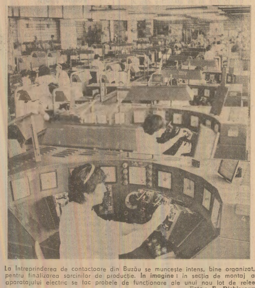
La întreprinderea de contactoare din Buzău se muncește intens, bine organizat...