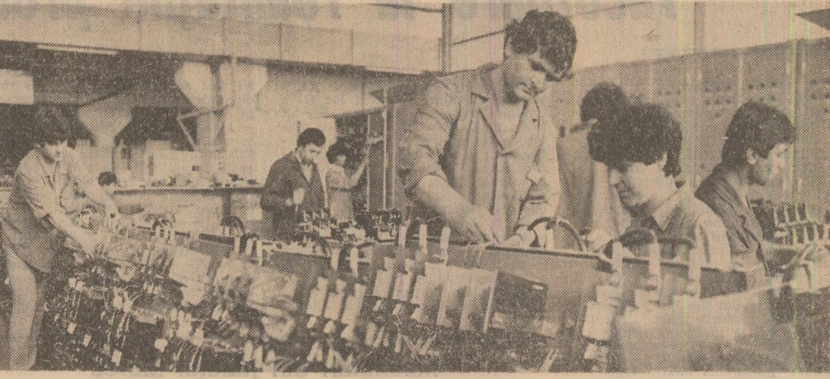
In aceste zile, colectivul Intreprinderii de panouri electrice din Alexandria este puternic mobilizat pentru a livra beneficiarilor interni...