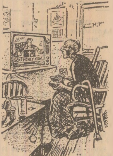
Indemnul predicătorilor electronici: „frimiteți boni fără intruziere” (Desen din ziarul „WASHINGTON POST”)

inegaliitate, generatoare de exploatare, ale orindului capitalist și deosebit de periculoase actiuni de creație. Dar această problemă are și un alt aspect important: de cele mai multe ori, misticismul, întregiți și spirit de diversi predicatori, constituie o sursă de enorme câștiguri. Așa cum este cazul „televanghelismului” american, despre care relatează într-un articol publicat în revista franceză „LE MONDE DIPLOMATIQUE”. Reproducem articolul respectiv, in forma prescurtată.