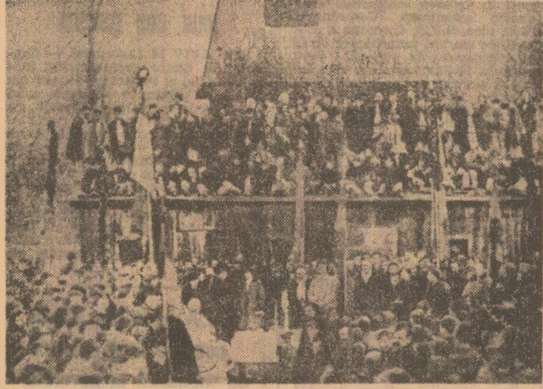
Alagarea delegaților pentru Adunarea de la Alba Iulia în Borșa - Maramureș