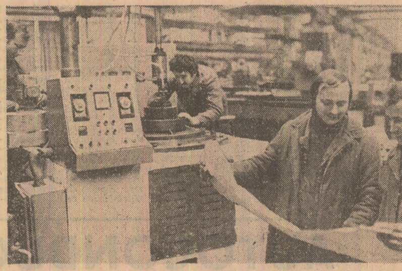
DIN ACTUALITATEA SOCIALISTĂ A ȚĂRII — reportaje • însemnări

Luminoase ale socialismului victorios, ale comunismului, drum în perspectivă a căruia învățămîntului îi revine un rol de maximă importanță.